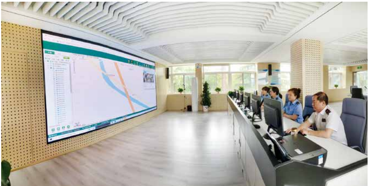
铜川市道路运输车辆动态中心（铜川市交通运输局）

【城市客运】 2022 年，铜川市积极推动新能源车应用，将北汽 EU5、比亚迪秦 EV、吉利几何 A pro 三款新能源车