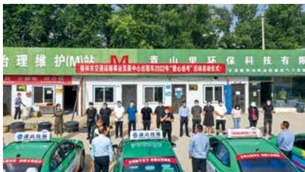
2022年6月6日，榆林市交通运输事业发展中心启动“榆林中心城区2022年度出租汽车‘爱心送考’公益活动”（榆林市交通运输局）

【出租车管理】 2022年，榆林市对中心城区11家出租汽车企业进行服务质量信誉考核，积极推行“黄牌警告、红牌停业”管理新举措，对出租汽车文明服务情况上路巡察，共检查车辆1105车次，做出“黄牌警告”71车次、“红牌警告”停业整顿61车次。累计办理出租车更新业务95辆、转让业务216辆，监督卡办理1276人。争取财政资金371.3万元，为中心城区1121辆出租车及驾驶员更换座套和服装，对800辆老旧出租车进行翻新喷漆，制作《榆林市出租汽车创建全国文明城市工作指导手册》，全面提升行业服务品质。