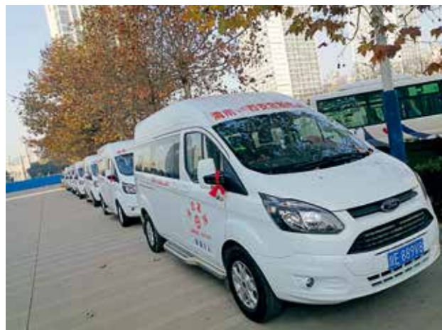
渭运集团定制客运车辆 (渭南市交通运输局)

白水至西安、富平至西安,富平至咸阳机场,渭南至西安,蒲城至西安、澄城至西安、合阳至西安、大荔至西安)车辆150台。