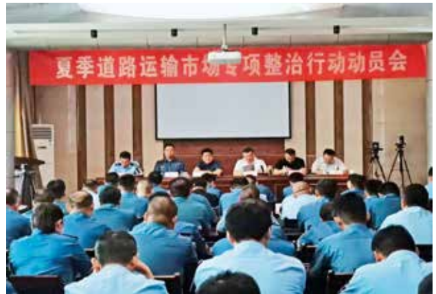
2022年7月5日，延安市开展夏季道路运输市场专项整治行动 (延安市交通运输局)

道路运输从业资格证850本，换(补)发1280本；诚信考核1050人；处理12345和12328热线投诉25件，解决遗留问题21件；安排道路运输从业人员从业资格考试6场，遗留超期道路运输从业资格证(2年内)恢复考试1次。