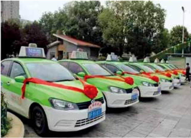
汉中市文明出租车（汉中市交通运输局）

级评定 1498 次，危货车辆等级评定 358 次，对 19 辆新参营的营运客车进行类型等级评定；积极开展节能减排、大气污染治理工作，全市建成 M 站 15 家，为机动车尾气治理提供有力保证。