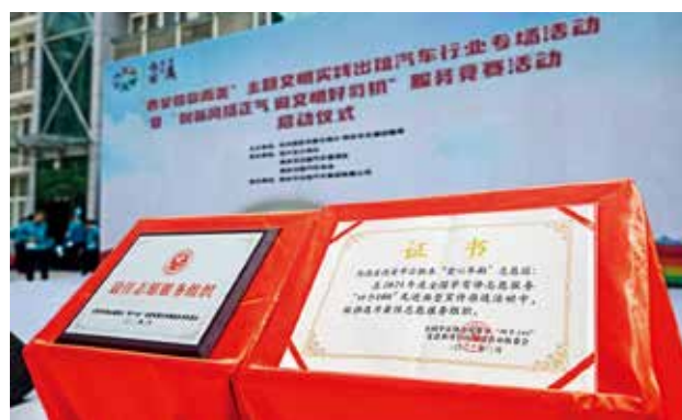
2022年西安市出租汽车行业“爱心车厢”志愿团被评为2021年度全国四个100“最佳志愿服务组织” (西安市交通运输局)

县处级出租汽车管理部门，编制56人，财政供养合同制人员20人。西安市有出租汽车17236辆，营运企业67家。市区有巡游出租汽车15457辆，经营企业48户。市郊五区二县有巡游出租汽车1779辆，经营企业19家。其中，阎良区223辆，临潼区600辆，长安区19辆，鄠邑区250辆，高陵区260辆，蓝田县210辆，周至县217辆。在市区巡游出租汽车中，吉利甲醇车8120辆，比亚迪电动车7337辆。许可网约车平台14家，办理网约车运输证24658辆。其中纯电动车20567辆，燃油车3827辆，混合动力车264辆。2022年，市区巡游车单车日均营运24.9个乘次，全职网约车日均订单12.8单，巡游出租汽车日均客运量56.3万人次，网约车日均客运量34.6万人次。2022年西安市出租汽车行业“爱心车厢”志愿团被评为2021年度全国四个100“最佳志愿服务组织”，“爱心车厢”志愿服务项目荣获陕西省第一届志愿服务项目大赛“二等奖”。