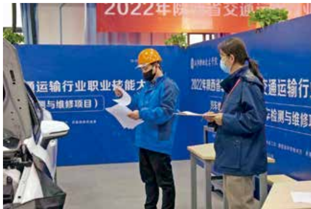
宝鸡市参加全省维修行业技能大赛 (宝鸡市交通运输局)

【道路运输概况】 2022 年，宝鸡市有客运企业 42 家，开通客运班线 279 条，客运车辆 667 辆；一级客运站 4 个、二级客运站 9 个、三级客运站 4 个；建有农村客运站 81 个、农村候车亭 713 个、招呼站 704 个；全市有巡游出租汽车公司 31 家，出租汽车 2680 辆；许可网约车平台企业 5 家，合规网约车 854 辆；机动车维修企业 731 家；驾驶员培训机构 39 家。货运物流公司 295 家，危险品运输公司 18 家、货运站场（货运物流园区）14 家，个体经营户 10269 家，普通货运车辆 19685 辆（不含 4.5 吨以下），危货运输车辆 1895 辆，完成公路货运量 11503.89 万吨，货运周转量 1349787 万吨公里。全市有道路运输从业人员（持从业资格证）61305 名。