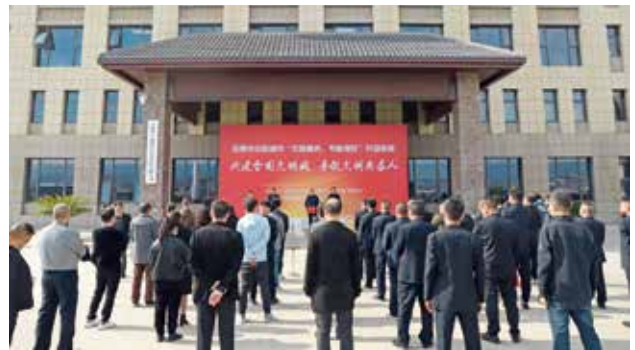
2022 年 10 月 14 日，安康市举办中心城市公交、出租车驾驶员“文明服务、节能提效”劳动竞赛活动（安康市交通运输局）

【客货管理】 2022 年，安康市大力发展道路客货运事业。新增纯电动新能源公交车 58 辆，更新公交车辆新能源车辆占比 100%。优化调整中心城市公交线路 1 条，中心城市公交网线覆盖率达到 91%，对全市 25 家客运企业、14 家汽车客运站、中心城市 4 家出租汽车客运企业开展道路旅客运输企业及汽车客运站质量信誉及服务质量信誉考核工作，评定质量信誉考核等级 AAA 级及以上的客运企业 5 家、客运站 1 家，AA 级企业 20 家、客运站 13 家。AA 级及以上的巡游出租汽车企业 4 家，B 级客运企业 1 家。对 11 家危险货物运输企业 199 台危险货物运输车辆进行道路运输证件年审；开展危险货物运输企业的质量信誉评价工作，评价 AA 级 5 家，B 级 2 家。