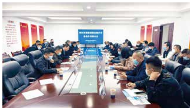
2022 年 11 月 9 日，咸阳市召开城区新能源出租汽车备选车型推介会

【城市客运】 2022 年，咸阳市更新清洁能源巡游出租汽车 56 辆，新能源巡游出租汽车 1 辆。全年发放疫情防控、新能源补助、交强险补助、油补等各类专项资金 3279.19 万元，做到准确及时拨付到位。完成疫情防控转运工作 2 次（医护、新疆）；适时调整客运班线和旅游包车运营情况，确定 7 家运输企业 61 辆车组成的生活物资运输保障车队，并建立台账，印发《疫情防控生活物资运输保障预案》。召开全市道路运输行业疫情防控知识培训会，全市 180 余家企业参会；为市区出租汽车驾驶员免费进行核酸检测 30 场次；全年接待 3 次城区出租行业驾驶员群体性上访，协调企业减免承包费 5 次约 729 余万元。