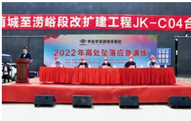
2022年4月28日，陕西交控建设管理公司、京昆改扩建项目管理处在JK-C04合同段共同举办高处坠落事故应急演练活动

营管理实际，建立起由 19 项安全生产制度、1 项综合应急预案、9 项专项应急预案及 3 项现场处置方案组成的安全生产及应急管理体系，扎紧筑牢安全生产防火墙，防止和减少安全事故发生。强化区域联动，充分发挥路网管理“一张网”作用，加强路网监测和现场监控，及时、准确、规范报告突发事件信息和重要紧急情况。