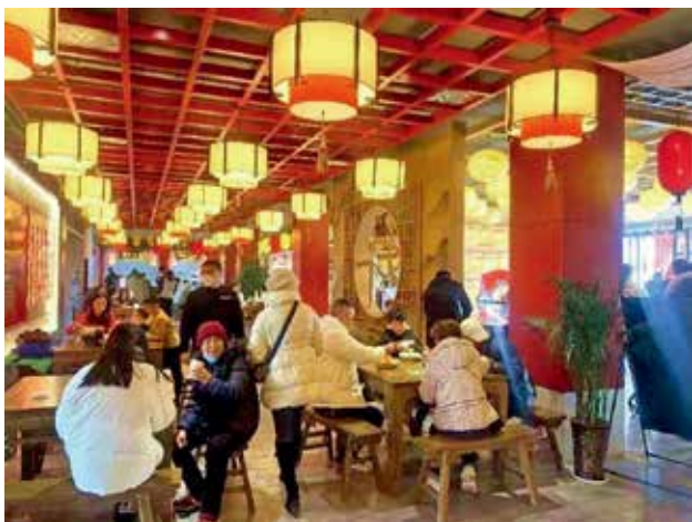
西安外环高速公路南段子午服务区场景 (陕西交控集团)

2022年9月，子午服务区正式对外运营。子午服务区是陕西省首个开放式休闲运动主题服务区，也是陕西省首个主打生态环保理念的服务区，该服务区位于西安外环高速公路南段，占地170亩，设置大小车位、房车位超700个，以运动休闲、生态康养、开放共享为主题定位，内含31个经营业态，是全省服务区品质工程和样板工程。服务区具有5大特色：一是陕西首个集休闲、运动功能为一体的服务区，设计有全省最大的服务区屋顶花园；二是陕西首个生态低碳理念服务区，设置集加油加气加氢为一体的能源岛，以光伏为能源岛提供电力；三是陕西首个开放式共享服务区，区内设有收费站与秦岭北麓环山地方路贯通，满足西安及服务区周边市民入区休闲的需求；四是全国最大的高速公路服务区室内数字运动体验馆，形成多核心智慧式体验场地；五是唐长安文化与服务区假日旅游休闲的融合，北区在建筑构造、内部装饰等以唐文化为主题设计，以“远离尘嚣、静享假日”为经营主题，开辟“慢生活”的房车露营地。