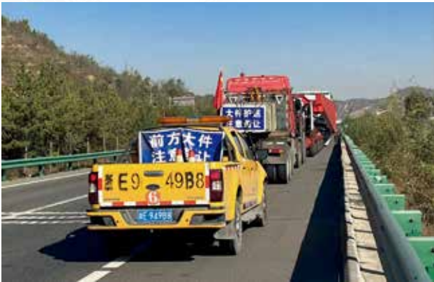
2022年10月24日，省路政执法总队第七支队联合榆林市高速交警支队五大队、六大队引导护送的上海巨神大件运输有限公司运输的变压器安全顺利通过陕西省（省路政执法总队）

【大件货物公路运输调研】 为解决企业产品外运困难，做好大件运输许可“一对一”服务，2022年8月23日，省公路局组织榆林市交通运输局、省高速公路路政执法总队、陕西交控集团及桥梁专家，赴榆林市就远景能源有限公司生产大件货物公路运输问题进行调研。