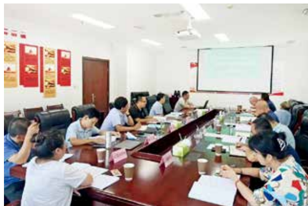
2022 年 8 月 12 日，陕西交控建设管理公司生产安全事故应急预案评审会召开。评审专家组一致认为，陕西交控建设管理公司生产安全事故应急预案结构健全，应急职责明确，内容全面，针对性和可操作性强，符合应急预案编制要求，通过评审（陕西交控建设管理公司）

位资质管理实施细则》，对申请公路养护资质的 132 家企业的 415 个资质进行初审，并向省交通运输厅上报初审意见。