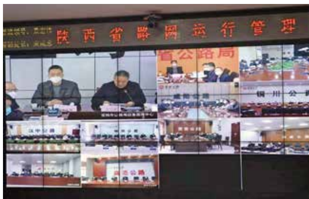
2022年12月15日，由省公路局主办，宝鸡市公路局承办的2022年全省公路冬季除雪保畅应急演练，通过现场加线上的形式成功举办。（省公路局）

【桥隧安全运行保障】 2022年，省公路局对标交通运输部重点桥隧监测要求，进一步明确全省重点桥梁隧道养护和管理规范化12个方面的具体要求，督促管养单位不断推动桥隧养护精细化、工作标准化、管理规范化。扎实开展高速公路长大桥隧省级巡检，完成普通国道3698座桥梁和172座隧道定期检查评定工作，充分运用桥隧检测成果，以问题为导向，列出问题清单，专项印发全省通报，督促管养单位落实整改措施，保障桥隧安全运行。组织开展全省桥隧工程师培训和养护技术培训，各市公路局、陕西交控集团、各收费公路经营公司200余人参加，提升桥隧养护管理队伍技术水平。