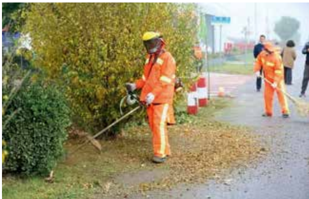
2022年11月7日，合阳县交通运输局组织举办全县首届农村公路养护作业技能比武大赛

20多辆次，对全县主要县乡村道开展全天候巡查，清扫路面积雪50多公里，为结冰路段抛洒融雪剂，按照“排查一处，处置一处”原则，采取机械与人工相结合的方式，抛洒融雪剂，紧急开展公路保畅工作。其他相关县区农路中心也积极安排人员上路巡查开展除雪工作。