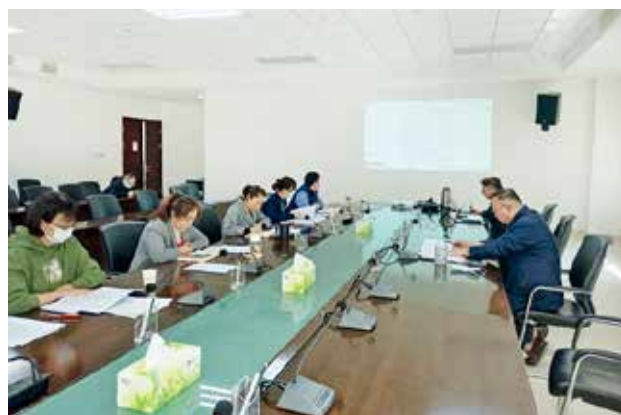
2022年3月11日,省高速公路收费中心通过线上视频会议形式组织召开全省2022年ETC发行服务提升工作座谈会(省高速公路收费中心)

【交通服务热线】 2022年,省高速公路收费中心一是不断加强交通服务热线运行管理,修订、印发《陕西省12328交通运输服务监督热线管理办法》;编制《2022度陕西12328运行情况通报》和12期《12328月度运行情况通报》。二是全面整合系统资源,完成12122与96166热线系统整合升级建设,实现“系统统一、人员统一、服务统一”;开展交通运输执法领域专项整治活动,积极倾听群众呼声,畅通投诉举报渠道。二是开展收集整理货车通行政策及通行证办理等疑难问题,编制完成7期《陕西省高速公路疫情防控应急物资运输有关通行政策指引》;印发20万份《陕西高速公路行车指南》;与省级电台制作5期“12122之声”节目;“陕西高速App”及“陕西12122”小程序每日完成平台路况直播,为公众提供“有声有色”的高速出行信息。三是加强团队建设,开展“青春心向党 服务再提升”红五月活动,通过党史学习、轮岗交流、亮身份等多种形式,学本领强素质,提升窗口服务水平。陕西交通服务热线(12328&12122)全年受理来电53万人次,热线工单限时办结率99.5%,信息咨询类即时答复率99.8%,投诉回访满意率98.9%;电台播报近1万次;新媒体平台服务量409万人次,日均服务1.12万人次。