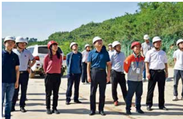
2022年7月21日，铜川市交通运输局召开上半年全市重点交通项目建设推进会，通报上半年全市重点交通项目建设情况，明确下半年工作目标 (铜川市交通运输局)

要求：一是各市要高度重视项目前期工作，成立工作专班，指定领导包抓，专人负责，提高报告编制质量；二是要做好沟通协调，分管领导要勤过问、勤督促，积极与相关部门沟通，协调解决难点堵点问题；三是各市对前期工作要一周一总结，一月一上报。会上，榆林等8个市交通运输局做汇报发言。