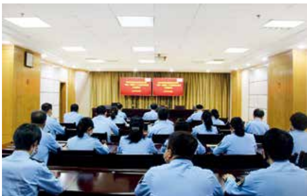
2022年9月30日，省路政执法总队召开全系统 国庆和党的二十大期间安全稳定工作视频会 (省路政执法总队)

【依法行政公开透明】 2022年，省路政执法总队一是深入学习贯彻习近平法治思想，加快法治部门建设，严格落实行政执法“三项制度”，全面落实行政执法责任制，建立重大执法案件法制审核提前介入机制。二是巩固深化执法领域突出问题专项整治行动成果，建立行政执法规范化长效机制，制定常态化开展问题查纠整改等工作措施13条。依照《陕西省交通运输综合行政执法事项通用目录》，公布总队行政执法事项55项。三是积极推行说理式执法、柔性执法、首违不罚、轻微免罚，执法工作有尺度更有温度。四是强化执法监督，建立高速公路路政重大执法案件法制审核提前介入机制，组织开展行政执法案卷评查活动3次，评查案卷802份，开展巡查监督检查334次、治超监督检查276次、执法监督检查224次，下发整改通知书122份。