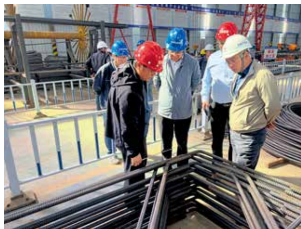
2022年6月，省交通工程质监站对麟法高速公路建设项目开展质量监督检查（省交通工程质监站）

【质量监督业务培训】 2022年，省交通工程质监站按照省交通运输厅批复的干部教育培训计划，举办2022年度全省质监人员业务培训班，采取线上授课的形式，邀请省内著名公路专家对水泥混凝土桥面沥青铺装病害防治与养护技术、公路桥梁质量控制要点等进行讲解，省、市交通工程质量监督人员共计200余人次参加培训。培训为进一步加强全省公路建设工程质量监督管理工作、持续推动公路建设高质量发展打下良好的基础。