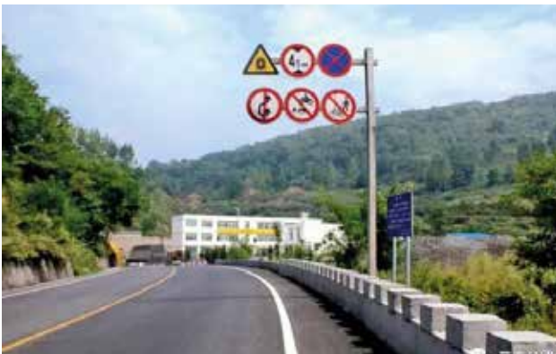
咸阳市公路局负责实施的国省道安全生命防护工程 (咸阳市公路局)

【全省冬季公路除雪保畅工作视频会议召开】 2022年10月31日，省交通运输厅召开2022年冬季全省公路除雪保畅工作视频会议。副厅长杨文奇出席并讲话，厅二级巡视员赵之胜主持会议。会议要求，要周密安排部署、紧盯工作重点，进一步强化工作措施落实；要加强值班值守、强化应急准备，确保公路运行平安顺畅；要加强指挥调度、强化安全意识，确保行业安全形势稳定。会议还对冬季水路交通安全提出要求。会上，省气象局首席专家分析2022年冬季气象形势，并提出防范应对意见；厅公路处对冬季全省公路除雪保畅工作进行安排；陕西交控集团、汉中市交通运输局、榆林市交通运输局、铜川市公路局分管领导做了发言。