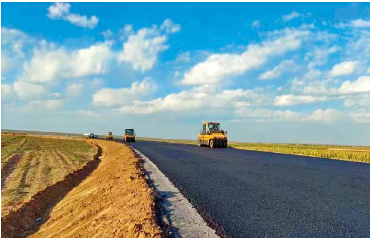
2022年，定边县交通运输局244国道红柳沟至水口界陕宁界公路建设项目施工现场（蔡斌）

命安全的“百吨王”超限超载行为，严格规范班线客运、包车客运、定制客运以及出租公交客运经营行为，确保道路运输安全稳定，保障人民群众平安出行，全年累计办理各类行政执法案件592件。继续加大汽修企业尾气治理安全规范，对县域维修企业进行执法检查，共排查治理汽修厂环保不达标企业200多家，严格要求违规维修企业对存有隐患问题立即或限期整改，切实消除隐患。加强规范驾驶员培训行业经营行为和市场秩序，全面清查驾培场所，重点强化对未取得驾培经营许可擅自从事培训活动的“黑”驾校、“黑”教练、非法培训点、非法招生网络平台，予以严打和取缔。在重点路段、重点区域，对公路上及公路用地范围内违规挖坑植树、倾倒垃圾、擅自增设、改造平面交叉道口、擅自设置非公路标志等违法行为，加大执法检查、检查力度，确保路产完好。