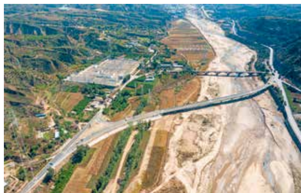
2022年，府谷县实施清水川（魏寨）大桥危桥改造工程

完成2021年自然村通村道路尾留工程23公里、农村公路安全生命防护尾留工程10公里，完成2022年自然村通硬化公路工程37项58.3公里，2022年完成投资4081万元。338国道府谷县城过境公路项目，路线全长13.1公里，采用一级公路技术标准建设，预算总投资11.4亿元。该项目前期手续全部完成，计划2023年6月份开工建设控制性工程。550省道府谷机场连接线项目，全长7.32公里，采用一级公路技术标准建设，预算总投资6.2亿元。所涉孤山川大桥的洪水影响评价报告通过专家组实地勘验，等待批复。计划2023年6月份开工建设。府谷县火车站扩能改造工程，2022年年底完成施工图设计。S10府神高速（龙口至庙沟门段），路线全长48.25公里（其中内蒙古境12.4公里，陕西境35.85公里），估算总投资64.22亿元。与准格尔旗方面就建设、接线等工作达成一致意见，设计单位对项目工程可行性研究报告进行修编。府谷（桑园梁）至木瓜公路改建一期工程，全长3.24公里，采用一级公路技术标准建设，预算总投资7500万元。该项目的前期土地报批组件全部完成，开展土地统征工作。计划2023年4月份开工建设。老高川至郭家湾公路改建工程，路线全长15.14公里，全线采用三级公路技术标准，设计速度每小时30公里，路基宽度8.5米，预算投资1.05亿元。该项目通过陕西省公路局技术审查，取得工程可行性研究报告批复，初步设计取得审查批复，进行洪评、地灾等各类专项报告的编制和审批。庙沟门镇沙孤村沙梁川中桥建设工程，桥长85.02米，桥宽8.5米，引线长370.19米，路线总长455.21米，设计速度每小时30公里，公路等级为三级，建安投资592.56万元，于2022年9月底建成通车。皇甫川园区道路，全长12.47公里，总投资9900万元，公路等级为二级，路面类型为沥青混凝土路面。该项目为续建工程，2021年9月开工建设，2022年9月建成通车。