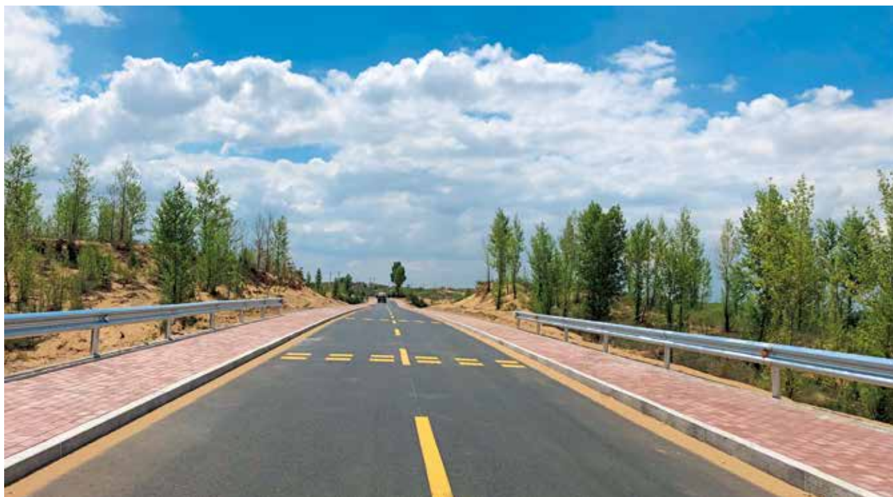
2022年5月，榆阳区补浪河女子民兵治沙连道路新划标线

公路养护 2022年，榆阳区成功入选“四好农村路”全国示范县创建单位名单。榆阳区交通运输局全面落实县乡公路公司化养管改革，构建农村公路管理养护长效机制。完成投资630万元的榆补路等道路提升改造工程、1180公