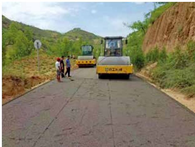
2022年7月18日，佳县交通运输局实施四合沟岔至圪崂湾三级公路改建项目路面工程

项目建设 枣坪至张岔（佳县段2.5公里）公路升级改造工程，建设完成，完成投资约1500万元。四合沟叉至圪崂湾三级公路改造工程（全长10.8公里）建设完成，完成投资3993万元。建成农村30户以上自然村通硬化路和通组联网道路53公里，完成投资约4200万元。实施农村公路安全生命防护工程101.1公里，完成投资2023万元。实施完成徐家沟危桥整治工程，总投资32万元。