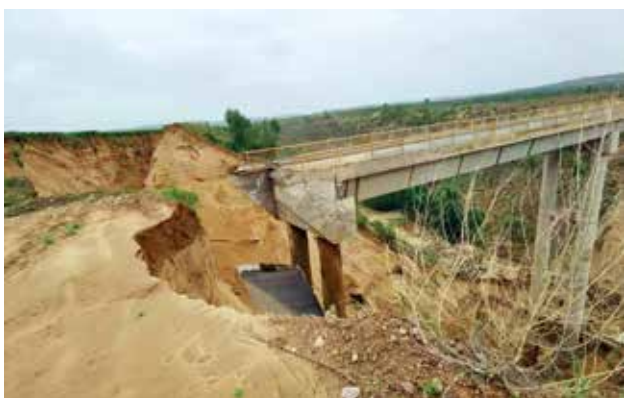
2022年10月,横山区交通运输局对王沟台大桥水毁进行修复

K31+662)、古水至靖边马莲坑、204省道至韩石畔3条路共计45.12公里为美丽农村路,全部验收合格。9月份,总投资708万元,涉及15条农村公路的安全生命防护工程全部完成。10月份,对遭受7月特大暴雨袭击的雷龙湾王家沟大桥进行加固改造,梁板全部预制完成,下部结构完成。7月份的两次强降雨导致道路损毁严重,共造成过境线8处、等级道路(县、乡公路)水毁10条65处、通村及砸砖路321条1291处,经济损失5364.58万元,局第一时间对所有灾毁路段进行抢修,全部抢修完成。