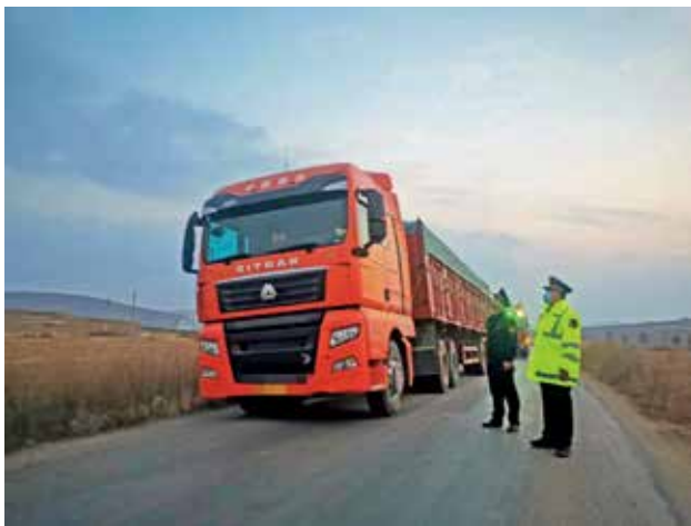
2022 年，靖边县交通运输局路政执法人员对超载超限车辆进行整改

行业治理 2022 年，靖边县交通运输局加大超载超限治理力度，坚持规范与整治并举，严格落实“一超四罚”和“黑名单”制度，共处理各类行政案件 406 起，处理抄告 351 条；办理超限运输案件 9 起；办理损坏路产案件 10 起，缴纳赔偿款 2.6 万元；办理私开平交道口案件 2 起，管线穿越案件 13 起，完成破坏路产申请强制执行案件 1 起；办理移交超限超载案件 1 起，罚款 1 万元；收缴罚没款及路产赔偿款 601 万元。持续开展道路客运市场整治，加强联合执法，依法检查各类车辆 2300 辆，查扣涉嫌非法运营车辆 41 辆；全年检查客运企业 20 次，检查客运车辆 320 次，依法查处未按规定线路行驶客运车辆 3 辆；纠正客运车辆违规行为 20 次。持续优化交通运输营商环境，贯彻落实“放管服”改革，建立协同共享机制，引导货运企业向现代化物流公司转变。进一步规范公共交通及投诉执法工作。全年共出动执法人员 500 人次，检查出租车 370 辆次，公交车 20 辆，现场纠正违法行为 19 起。接到各类投诉 540 起，其中平台投诉 312 件，电话投诉 228 次，均按时解决并回复，满意率达 98%。