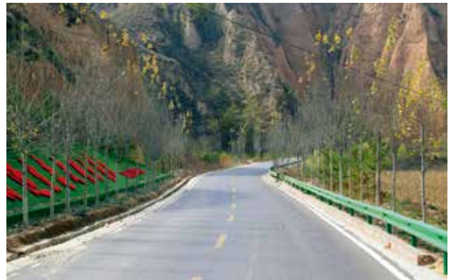
2022年11月，清涧县交通运输局双十路日常养护成果

资1282.97万元用于石太寺至小岔子、西沟贬至刘家川等道路的路面维修、安保及灾害治理；实施水毁抢修工程13处，投资340万元；县、乡、村公路技术状况指数分别为75.6、74.3、65.8。被榆林市交通运输局评为2022年度农村公路先进单位。