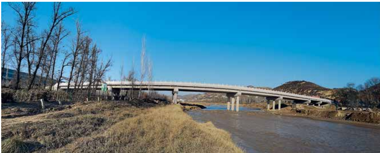
2022年，绥德县绥北物流大桥完工

进行路况自动化检测。农村公路优、良、中等路比例达75%。县、乡、村公路技术指数分别为76.5、75、74.6，专用公路75，进一步提升公路技术保障水平。大力推进“四好农村路”省级示范县创建，强化示范带动，巩固“四好农村路”创建成果。全县有7个乡镇创建“四好农村路”市级示范镇，1个初验完成县级示范镇建设，占全县乡镇总数的50%。持续打造吉后路标准化养护工区，创新农村公路斜撑式镀锌钢板新型急流槽施工工艺，优化完善互联网+“四好农村路”信息化管理平台。开展道路隐患排查治理，共排查隐患问题345项，其中，“路”的方面隐患问题272项，整改完成105项；“企”的方面隐患问题73项，完成73项；“车”的方面隐患问题168项，全部整改完成。