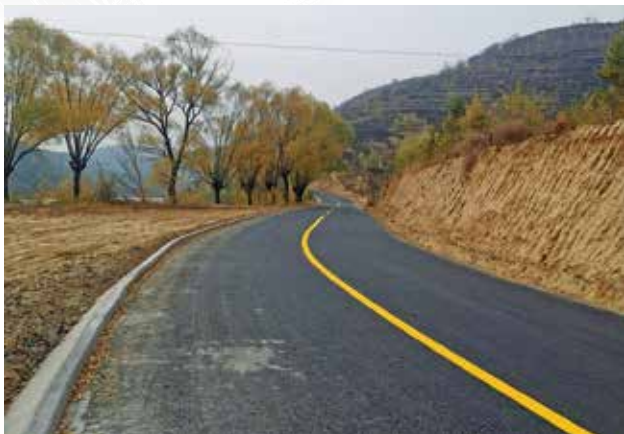
2022年，米脂县交通运输局实施龙镇哈流咀至郭家砭公路改造工程

公路建设 2022年，米脂县交通运输局累计完成固定资产投资10500万元。实施龙镇哈流咀至郭家砭公路改造工程9.7公里，总投资约3500万元；实施242国道米脂榆林沟平交口改造工程1.07公里，总投资1663万元；实施242国道米脂十里铺平交口安全隐患整治工程，总投资约3100万元；实施杨家沟旅游道路延伸段1.63公里，总投资399.89万元；实施杨家沟电瓶车道路建设项目0.88公里，总投资369.41万元；实施火车站候车室及设备改造工程，总投资2120万元；实施米坑路至李鼎铭旧居、桃镇粮站至石家甲等6个通组道路7.3公里，总投资373万元；实施路网连通路3.8公里，投资230万元；实施桃镇至官家湾、哈流咀至孙家沟、小石砭至宋家沟路基防护、白硷至班家沟公路沥青路面补坑槽罩面及佳米路砭边沟维修等工程，投资332万元；实施陈岔至折家坪等村级公路波形梁钢板护栏16.16公里，投资200万元。完成3个县乡公路项目前期储备工作。积极配合做好延榆鄂高铁项目米脂段前期相关工作。