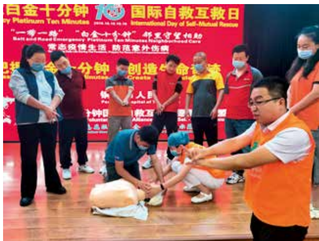
2022年9月15日，铜川市邮政管理局联合市总工会举办新业态劳动者应急救护能力提升培训班，组织参训快递小哥开展心肺复苏和咽喉异物急救实操演练（铜川市邮政管理局）

【推进农村寄递物流体系建设】 2022年，铜川市邮政管理局一是推动铜川市政府办公室印发《铜川市加快推进农村寄递物流体系建设实施方案的通知》，明确建设任务和由各区县负责推动此项工作等内容。二是印发协调推进机制组成成员及工作职责的通知，明确分管副市长为总召集人，由市交通运输局、市乡村振兴局、市邮政管理局牵头，会同相关成员单位共同推进。三是印发《关于区县交通运输部门承担本辖区内邮政快递行业监管职责的通知》，完善县域邮政快递业监管机制。四是争取农村寄递物流体系建设政策、资金支持，对完成全市建制村“快递进村”全覆盖的快递企业，一次性奖补10万元。五是积极推进农村客货邮融合发展，印发《农村客货邮融合发展实施方案》，指导、支持邮政企业积极开展示范点建设，率先在宜君县彭镇建成“客货邮”综合服务站。六是积极协调支持邮政公司与各区县签订三级物流体系建设合作协议。七是持续推动“快递进村”工程，宜君县通过邮快合作，117个建制村全部实现邮快合作。