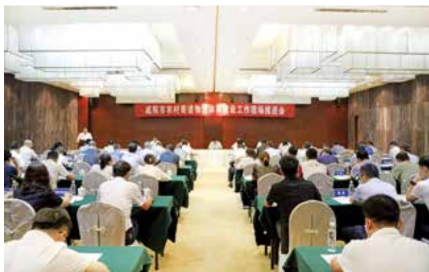
2022年8月3日，咸阳市召开农村寄递物流体系建设工作现场推进会（咸阳市邮政管理局）

【邮政业助力乡村振兴】 2022年，咸阳市邮政管理局用心用力做好定点帮扶工作，为帮扶村争取专项资金15万元，巩固拓展脱贫攻坚成果。指导邮政企业打造旬邑马栏红苹果、武功猕猴桃、泾阳净菜等“一市一品”农特产品进城示范项目5个，农特产品寄递业务量3052.01万件，带动农特产品销售额7.83亿元。礼泉县裴寨村樱桃项目成功入选国家邮政局“一市一品”农特产品进城经典案例。巩固咸阳苹果和猕猴桃两个快递服务现代农业“金牌项目”，实现苹果寄递1455.9万件，猕猴桃寄递1592.72万件，带动农产品销售额约10.44亿元；成功打造礼泉黄桃、泾阳西红柿、淳化苹果等6个快递服务现代农业铜牌项目。指导咸阳邮政、礼泉中通、礼泉极兔等企业申报快递服务现代农业项目。