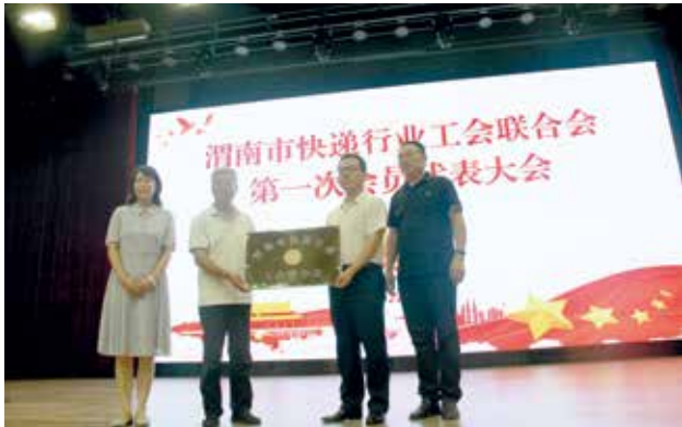
2022 年 8 月 3 日，渭南市快递行业工会联合会成立（渭南市邮政管理局）

处，普遍服务营业和投递质量得到提升。加强巡视专用邮箱监管和研究生考试试卷的运输保障。持续推进邮快合作，邮快合作建制村占比达 38.1%。做好机要通信监管工作，对全市 11 个机要场所进行 2 轮全覆盖检查。加大“扫黄打非”监管力度，建成一批邮政快递业“扫黄打非”基层工作站示范点。