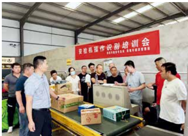
2022 年 7 月 12 日至 14 日，渭南市邮政管理局联合市烟草局在临渭区、澄城县、蒲城县组织开展安检机操作识别培训会（渭南市邮政管理局）