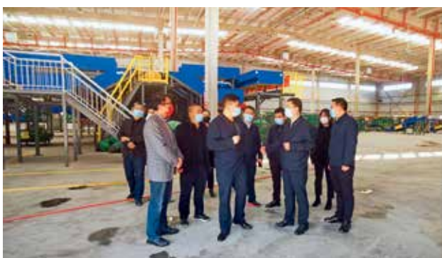
2022年10月18日，延安市副市长吴群英检查指导邮政快递业党的二十大期间寄递安保和疫情防控工作（延安市邮政管理局）

【邮政业普遍服务】 2022年，延安市邮政管理局加强邮政综合服务平台建设，拓展综合服务平台内容，打造服务型网点，全市13个政务服务综合大厅均设置邮政服务窗口，共设有20个代办公安交管业务的邮政所，13个县（市、区）均签订税邮合作协议并开展相关业务，全市警医邮合作逐步拓展，便民服务目标逐步实现。建制村直接通邮打卡率平均在95%以上，县级城市党政机关党报当日见报率100%不降低。农村邮路汽车化率达到31.2%，列全省前列。2022年高考录取通知书寄递服务保障工作，实现“零误投、零丢失”。