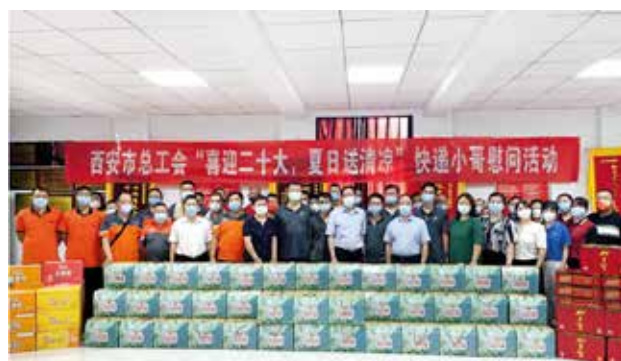
2022年8月23日，西安市总工会、市邮政管理局联合慰问咸阳中通快递西北转运中心一线快递员工

检和义诊覆盖人次近1.4万人次，先后为1000余名快递员开展上门体检服务，定期免费为全市快递员开展法律咨询和心理健康服务。三是推动建立快递行业职工医疗互助保障计划，鼓励企业为快递员建立多层次保障体系，1550人纳入职工互助保障计划。联合市人社局等单位成立工作专班，合力督促企业为快递员办理工伤保险，全年全市参加社会保险人员突破2万，优先参加工伤保险快递员5652人，实现快递从业人员保险全覆盖。四是积极推动快递电动三轮车“亮尾靛箱”工作，对全市1000辆快递电动三轮车进行美化靓化，并在全市快递企业中推广“一盔一带”安全守护行动，着力解决快递员群体最关心、最直接、最现实的合法权益问题，全面提升快递员群体的获得感、幸福感和安全感。五是积极落实国家邮政局等7部委《关于做好快递员群体合法权益保障工作的意见》，争取到市专项财政资金335.4万元，引导快递企业不断加大培训力度，组织从业人员应培尽培，愿培则培，教育员工从“要我学”向“我要学”转变，对全市7141人次开展快递员技能提升培训。