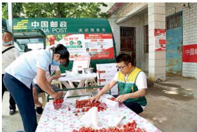
2022 年秋季，渭南邮政快递寄递樱桃，助力乡村振兴 (省邮政管理局)

超大进口揽投部拆分重组，投递效率进一步提高。高铁、民航新邮路持续开通；新开通西安—首尔、莫斯科航空专线和中欧班列长安号邮路；“三关合一”新场地投产运行，跨境电商运营实现新突破。构建寄递服务质量、运营质量两大管控体系，把握寄递时限“生命线”，建成省、市、县、生产机构四级质量保障体系。全省寄递时限稳步提升，快包省内时限领先竞品 8.32 小时。