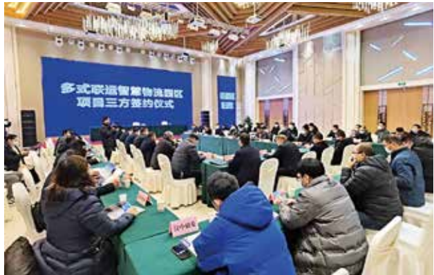
2022 年 1 月 25 日，汉中市邮政管理局、汉中市快递行业协会、省物流集团陕南投资公司联合举行柳林智慧物流园区项目三方签约仪式（汉中市邮政管理局）

【邮政业快递市场监管】 2022 年，汉中市邮政管理局实施“双随机、一公开”监管，加强与邮政执法队伍工作联动，立案查处 30 起。深入宣传贯彻《邮政业寄递安全监督管理办法》，推动落实中央和地方安全监管共同事权。强化“陕西寄递安全管理 5 条”督促落实，全力保障冬残奥会、市党代会、党的二十大等时段寄递渠道安全畅通。组织开展党的二十大安保、自建房安全、消防安全、生产器械等专项安全检查，停业整顿网点 6 处。推进安全生产专项整治三年行动，配合各部门做好寄递渠道反恐、禁毒、涉枪涉爆、打击侵权假冒、烟草打假、野生动植物保护、松材线虫病防治等专项工作。动员从业人员积极参与反诈工作，督促企业严格落实用户数据安全保护制度，纠治利用快递服务信息从事“刷单炒信”行为，检查场所 33 次，开展教育培训 10 次。督促 33 家企业修订应急预案，提升风险防范意识和应急处置能力。