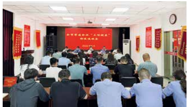
2022 年 5 月 31 日，西安市邮政管理局召开全市寄递企业“三项制度”推进通报会议 (西安市邮政管理局)

为更好服务西安制造业发展，西安市邮政管理局支持快递企业对接制造企业，进驻制造业产业聚集区，依托生产要素集聚优势，主动嵌入制造业生产供应链。顺丰、京东等快递企业签订企业协议用户超过 2 万余家，为三星、华为、小米、比亚迪、法士特、陕重汽等知名在陕企业和陕西众信医药超市连锁股份有限公司、西安长庆化工集团等企业提供优质高效的寄递服务。全年累计协助各类企业寄递快件超过 2000 万件，通过“中欧班列长安号”运输邮件快件超过 3000 吨。