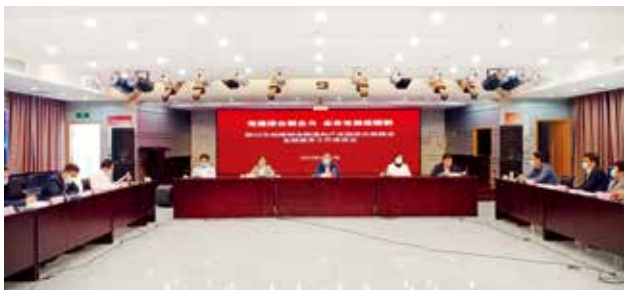
2022年5月9日，铜川市邮政管理局联合人行铜川市中心支行、铜川银保监分局召开全市保障物流畅通和产业链供应链稳定金融服务工作会 (铜川市邮政管理局)

【快递业市场监管】 2022年，铜川市邮政管理局一是开展末端投递服务专项整治。严格查处快递末端不按址投递等违规行为，立案处罚2起。二是持续提高行业申诉处理水平。专题分析存在问题，定期通报督促企业改进客户服务。全年处理12345转办工单566起、申诉64件，市局电话处理投诉786件。三是开展快递市场秩序整顿工作，着力整治快递“黄牛”、利用快递服务“刷单”、低价无序竞争、快递末端服务不规范等6个重点突出问题，有效清理违法违规违法行为。四是深化“放管服”改革。依法开展行政许可变更、分支机构备案和末端网点备案登记工作，审核分支机构2家，末端网点备案登记60余家，完成3家企业实地核查并通过审核。