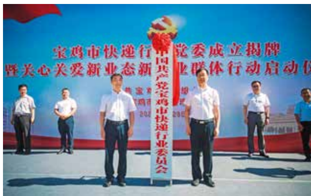
2022 年 6 月 29 日，宝鸡市快递行业举行党委成立揭牌仪式

准的包装材料应用比例 99.6%，按照规范封装操作的比例达到 99.4%，电商不再二次包装比例达 99.7%，可循环快递箱使用量达到年度任务目标 6980 个，寄递企业回收复用瓦楞纸箱 121.5 万个，新能源车辆保有量达到 84 辆，完成全年目标任务。积极落实国家邮政局、省邮政管理局关于邮件、快件包装袋重金属及特定物质超标检测工作安排，对宝鸡申通的封装用胶带、快件集装袋和快递包装袋进行检查和抽样，并将样品封装寄往北京邮政科学研究规划院检测实验室进行检测。组织开展全市邮件、快件包装袋检查及产品质量抽查工作，对全市 10 个品牌寄递企业的邮件、快件包装袋贯彻落实国家标准情况、使用标准封装用品情况以及执行邮政行业监管政策情况进行现场检查，并现场封样，按时将样品送至陕西省产品质量监督检验研究院。有序推进全市邮件快件包装操作规范备案工作，推进包装减量化、标准化和循环化，全市 35 家许可企业全部完成备案及审查工作。对寄递企业提交的邮件快件包装操作规范严格审核，对包装操作规范不符合有关规定和要求的，通知企业根据相关法律法规以及强制性标准进行修改完善。