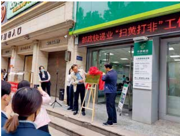
2022 年 9 月 23 日，咸阳市首批邮政快递业“扫黄打非”基层工作站授牌仪式举行

【咸阳邮政行业概况】 2022 年，咸阳市邮政行业业务收入 19.1 亿元，同比增长 11.7%；邮政行业寄递业务量 2.24 亿件，同比下降 1.3%。其中，快递业务收入 11.52 亿元，同比增长 10.4%；快递业务量 1.45 亿件，同比下降 3.8%。咸阳市邮政管理局积极推进《咸阳市交通运输领域市级与县级财政事权和支出责任划分改革实施方案》关于全市邮政领域市级与县级财政事权和支出责任的落实。推进成立市级邮政业安全发展中心。