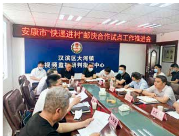
2022 年 4 月 2 日,安康市召开“快递进村”邮快合作试点工作推进会 (安康市邮政管理局)

【邮政业普通服务】 2022 年,安康市邮政管理局一是普遍服务质量进一步优化。巩固提升建制村 100% 通邮工作成效,提高行政村投递频次和服务水平。减少委托办局所 8 处,占比持续下降。做好 2022 年高考录取通知书寄递服务保障工作,实现“零误投、零丢失”。扎实开展机要通信邮路外包、机普混合作业专项自查整改,确保机要通信工作万无一失。二是邮政服务水平明显提高。坚持以人民为中心的发展理念,推动省邮政业申诉处理热线与市政府便民服务热线实现合并,消费者投诉申诉处理机制更加顺畅。加强各企业投诉平台和投诉处理监督管理,严厉查处各类侵害消费者合法权益的违法行为,着力解决邮政快递服务热点、难点问题,提升消费者满意度。