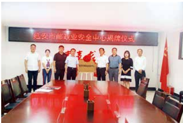
2022 年 7 月 28 日，延安市邮政业安全中心正式揭牌成立 (延安市邮政管理局)

【邮政业助力乡村振兴】 2022 年，延安市“延安苹果”寄递业务量 1922.74 万件，业务收入 1.54 亿元，带动农产品销售额 11.32 亿元，销售额同比增长 48.5%。“延安杂粮”寄递业务量 185.26 万件，业务收入 2223.08 万元，带动农产品销售额 8243.92 万元，销售额同比增长 51.9%。培育“一县一品”超 10 万件项目 16 个，同比增长 33.3%。持续推动中通快递集团陕北（延安）智能科技电商快递产业园项目建设，2022 年落实投资 1.5 亿元；成功推动韵达快递延安电商物流产业园项目落地甘泉县。成功推动吴起县扩建县级综合快递分拣中心，融合快递品牌 6 个，成功推动延川县新建县级综合快递分拣中心，融合快递品牌 5 个。延安局荣获全市 2021 年度重大产业项目优秀招商团队奖。