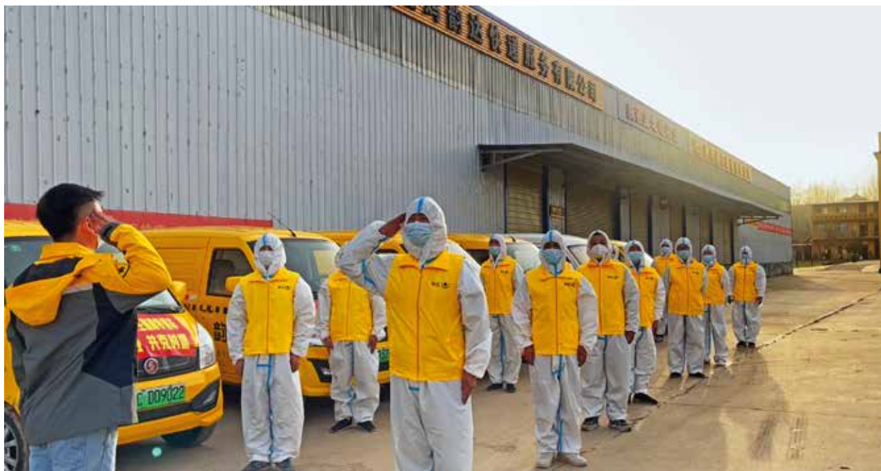
2022年3月9日，宝鸡韵达快递积极参与疫情防控工作（宝鸡市邮政管理局）

地址提供投递服务行为依法查处，并在全市通报。四是打击快递“黄牛”，维护猕猴桃寄递市场秩序。对猕猴桃主产区以外的寄递企业实行备案管理，对所有参与猕猴桃寄递工作的一线收派人员发放工作证进行统一管理，有效遏制快递市场“黄牛”扰乱市场秩序行为，维护广大果农合法权益。