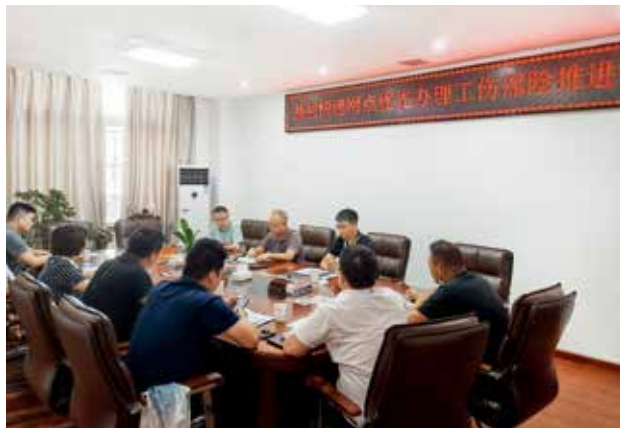
2022年4月13日，安康市召开基层快递网点优先办理工伤保险推进会（安康市邮政管理局）