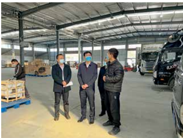
2022 年 11 月 15 日，商洛市政府副市长孙举恒一行调研全市邮政快递企业发展经营情况 (商洛市邮政管理局)

【邮政快递业市场监管】 2022 年，商洛市邮政管理局一是依法从严监管邮政普遍服务。全年共办理暂时停止邮政普遍服务备案 101 个、迁址备案 2 个、信息变更备案 14 个。二是严格开展快递业务经营许可审核。全年共办理新办企业许可 1 起、许可延续换证 1 起、配合省局注销企业 2 家，办理分支机构备案 14 起、末端网点备案 92 起，邮寄分支机构名录 1 起。三是坚守安全底线，深化安全主体责任建设。严格执行实名收寄、开箱验视、过机安检三项制度，认真落实陕西“寄递安全管理 5 条”，与商州区检察院开展联合检查，协同推进“七号检查建议”落地实施，通过实名监管系统开展常态监管，全市实名率稳定在 99.5% 以上。四是开展邮件快件处理场所安全管理规范化行动“回头看”，全面落实“四个全覆盖”“五个必须”“六个严禁”要求。与市烟草公司建立联合执法机制，设立联合执法工作站，有效震慑寄递渠道烟草违法行为。五是扎实开展寄递渠道“扫黄打非”专项执法检查活动，全年共出动执法人员 66 人次，检查邮政营业场所 13 处、快递网点 20 处，抽查报刊发行单位 1 个，抽查接办目录 13 个，未发现涉黄涉非物品。市局机关荣获 2021 年全市“扫黄打非”先进集体。