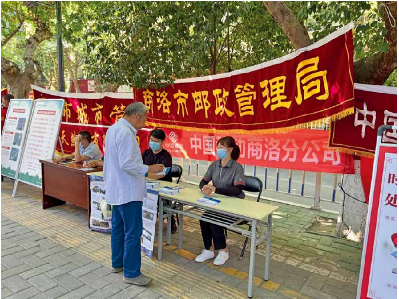
2022年6月16日，商洛市邮政管理局开展“安全生产咨询日”活动（商洛市邮政管理局）