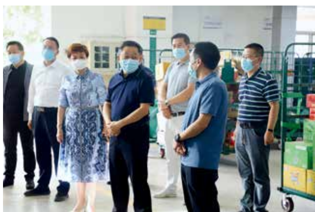
2022 年 6 月 7 日，榆林市政府副市长徐刚专题调研指导全市邮政管理工作（榆林市邮政管理局）

【邮政业市场监管】 2022 年，榆林市邮政管理局一是将安全监管责任压紧压实。深入学习贯彻习近平总书记关于安全生产重要论述重要讲话精神，圆满完成党的二十大、全国“两会”等重大活动期间寄递安保工作；统筹做好行业禁毒、涉枪涉爆、危险化学品、反恐、打击侵权假冒等专项整治工作；深入落实 7 号检察建议，下发《关于落实最高人民检察院“七号检察建议”进一步加强寄递渠道安全管理工作的通知》，联合市、区检察院及区公安局进行监督检查；不断加强寄递渠道安全管理，落实“双随机、一公开”随机抽查执法检查工作机制，出检 1537 人次，下发责令改正通知书 60 份，约谈 16 起，立案处罚 23 起，处罚金额 7.45 万元。二是安全专项整治扎实有效。稳步推进邮政快递业安全生产专项整治三年行动巩固提升，不断完善和落实安全生产责任和管理制度，建立寄递安全、生产安全隐患排查和预防控制体系；深入开展邮件快件实名收寄、邮件快件处理场所安全管理规范化提升行动和安全风险隐患排查整治等活动，指导帮助企业消除安全隐患，提升安全管理规范化水平。三是监管基础保障不断夯实。深化寄递渠道安全联防联控，将海关和检察院纳入寄递安全管理领导小组，明确工作职责；充分发挥邮政业安全中心的支撑保障作用，有序开展申诉处理、信息平台应用、安全监管执法检查及从业人员培训等相关工作；联合市委编委办、市交通运输局印发《关于加强县市区交通运输管理部门邮政管理职能体系的通知》，在 12 个县市区交通运输局下属事业单位加挂“邮政业安全发展中心”牌子，监管体系得到进一步完善。