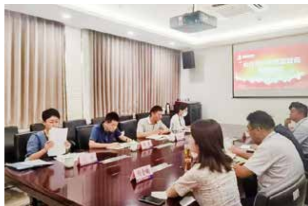
2022 年 6 月，民航陕西监管局对西安咸阳国际机场两家航空物流公司开展专项安全检查

【民航安全检查】 2022 年，民航陕西监管局组织开展多轮行业安全大检查、全国安全生产大检查民航专项检查和防范化解重大风险专项整治，持续推进“26 条措施”回头看，实现安全生产专项整治三年行动巩固提升阶段的重大目标。在辖区安全大检查中，发现问题隐患 199 个，挂牌督办问题 3 个。先后对长安航空、幸福航空公司开展综合安全审计，督促建立完善 AOC 运行体系，扎实开展维修故障排查和精细化监管。