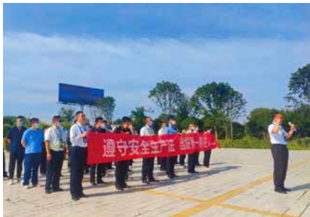
2022年6月，汉中机场组织开展“安全生产宣传咨询日”活动，由机场公司领导带领各部门代表进行安全生产宣誓

岗位责任履行，从制度层面和行动层面压实责任，当好各自岗位的第一责任人；狠抓各级岗位的按章运行，强化手册执行，做手册员工；狠抓人员资质管理，确保资质考核管理的公平、公正、透明，严禁发生资质造假等诚信问题。