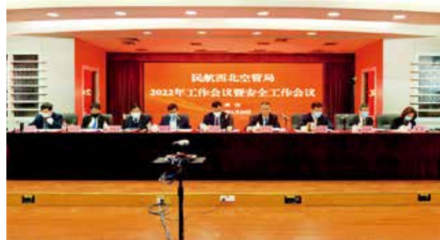
2022年1月26日，民航西北空管局召开2022年工作会议暨安全工作会（民航西北空管局）

【民航无线电保护】 2022年9月15日，民航西北空管局联合省无线电管理委员会西安市监测站、民航陕西监管局以及相关单位以“电波连接你我他，维护秩序靠大家”为题，组织召开座谈交流会。西北空管局介绍西安辖区台站分布以及民航无线电频率保护机制，回顾前期机场周边GPS及TCAS干扰的排查处置全过程，提出无线电干扰处置中的困难和建议。民航陕西监管局介绍无线电干扰排查和管理工作。西北空管局感谢西安市无线电监测站对西北空管局无线电干扰排查工作的支持。同时提出，2022年上半年GPS和TCAS干扰严重影响空管运行安全，建议西安市政府要高度重视，建立相关制度和机制，加大民航无线电保护管理宣传，加强源头治理，加强与辖区内特殊单位的沟通协调，及时通报干扰情况。同时，对于已查处的无线电干扰情况，应从严肃处理，对潜在的无线电干扰源形成威慑。会后，与会人员在西安咸阳国际机场向市民发放《治理非法用频设台宣传册》，提高大家对无线电管理、频率保护等维护无线电秩序的法律意识。