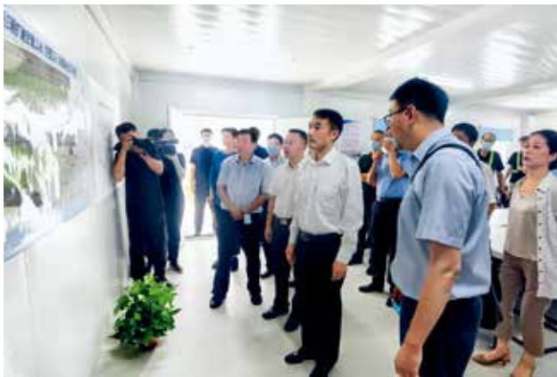
2022年8月4日，西北地区管理局党委书记熊杰一行调研西安咸阳国际机场三期扩建空管工程（民航西北空管局）

【西北地区空管安全管理专题会议】 2022年4月26日，民航西北地区管理局组织召开西北地区空管安全专题会议。西北管理局、各监管局，西北空管局、各空管分局，各机场集团、各机场公司领导和相关部门负责人共144人通过线上视频参加会议。西北管理局空管处就西北空管局、各空管分局落实《关于深入开展全国安全生产大检查西北民航专项检查的通知》进行工作部署，对前期中小机场安全大检查发现的主要问题通报，对中小机场空管安全管理专项检查工作提出要求，对部分单位在检查工作中存在的问题和建议进行交流答疑。西北管理局副局长孙剑岷对下一步安全管理工作提出5点要求。