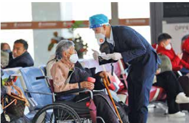
2022年春运期间，西安咸阳国际机场工作人员热情为旅客服务

2022年7月22日，西部机场集团在榆林举办“陕西支线机场首乘服务升级行动”启动仪式。民航陕西监管局和西北管理局相关部门进行现场观摩和指导。陕西省各支线机场推出各具特色的首乘服务升级品牌，榆林机场“愉快飞·首乘+”，延安机场“圣地真情”，汉中机场“首乘易行”和安康机场“安E行”受到与会单位积极评价。各航空公司、OTA平台围绕机票优惠、地面服务保障等首乘旅客专享升级产品进行推介，东航“首乘+”系列产品，南航“首乘2.0”，同程旅行“首乘2.0升级迭代”等首乘升级产品得到广大旅客热烈欢迎。各单位还结合西北管理局首乘服务“三进”活动，推出首乘服务“进社区、进企业、进校园、进乡村”活动，扩展首乘服务的外延。仪式上，各支线机场分别与同程旅行签订战略合作协议，各单位将围绕首乘服务精诚合作，发挥各方资源优势，强化客源组织、航旅开发、市场营销等深度合作，打通首乘服务堵点，解决首乘服务痛点，努力为首乘旅客提供更优质、更便捷的出行体验。据统计，2021年9月首乘活动开展以来，陕西各支线机场保障首乘旅客2000人次，收到群众表扬信15封，电话及留言表扬500余次。