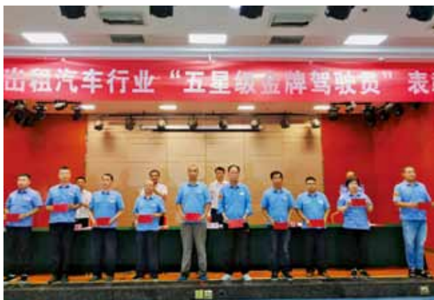
2018 年 7 月 12 日，西安市出租汽车行业“五星级金牌驾驶员”表彰会在西安召开，表彰“五星级”驾驶员 101 名，全年累计表彰 276 名