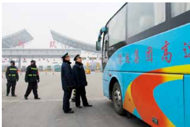
2018 年，西安市交通运输管理处执法人员对长途客运车辆进行安全检查

企业 21 条铁规，开展安全生产宣传教育和隐患排查整治活动。全行业继续保持连续 10 年未发生较大以上道路运输事故，各项事故考核指标稳中有降，行业安全生产形势稳定向好。