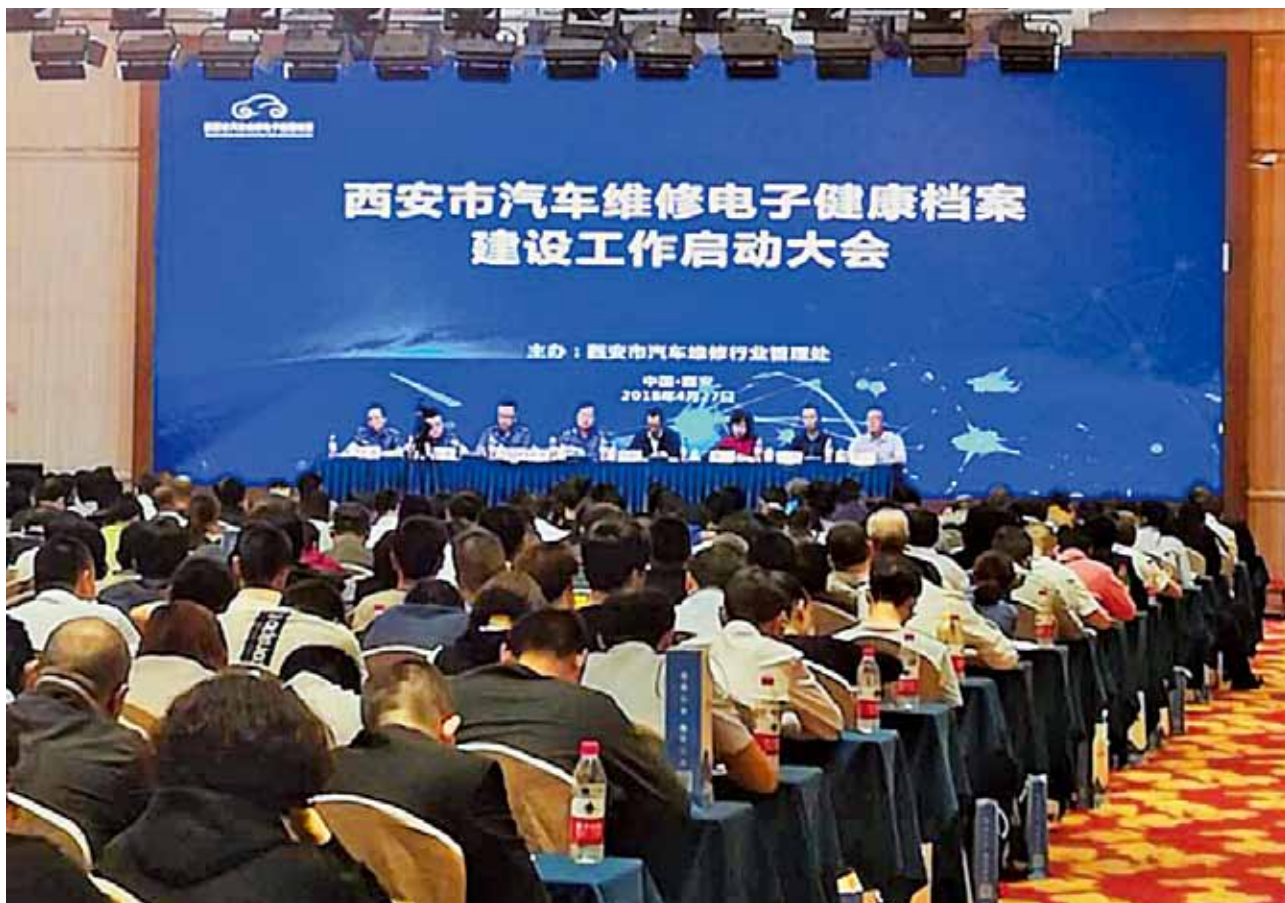
2018年4月27日，西安市召开汽车维修电子健康档案建设工作启动大会（余曼）

货运输驾驶员从业资格许可初领申请 8457 人次，组织考试 76 场，继续教育业务受理 3.09 万件，诚信考核受理 2.81 万件，注（吊）销从业资格证 1030 本。（薛砚田）