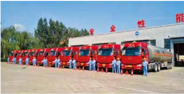
2018年，宝鸡永联公司整装待发的特种货物运输车队

【经营发展】 宝鸡永联公司除营运车辆之外，积极探索运输产业转型升级。公司投资成立永联正源实业有限公司，斥资 5.8 亿在长青工业园征地 120 亩，建设 10 万吨甲醇下