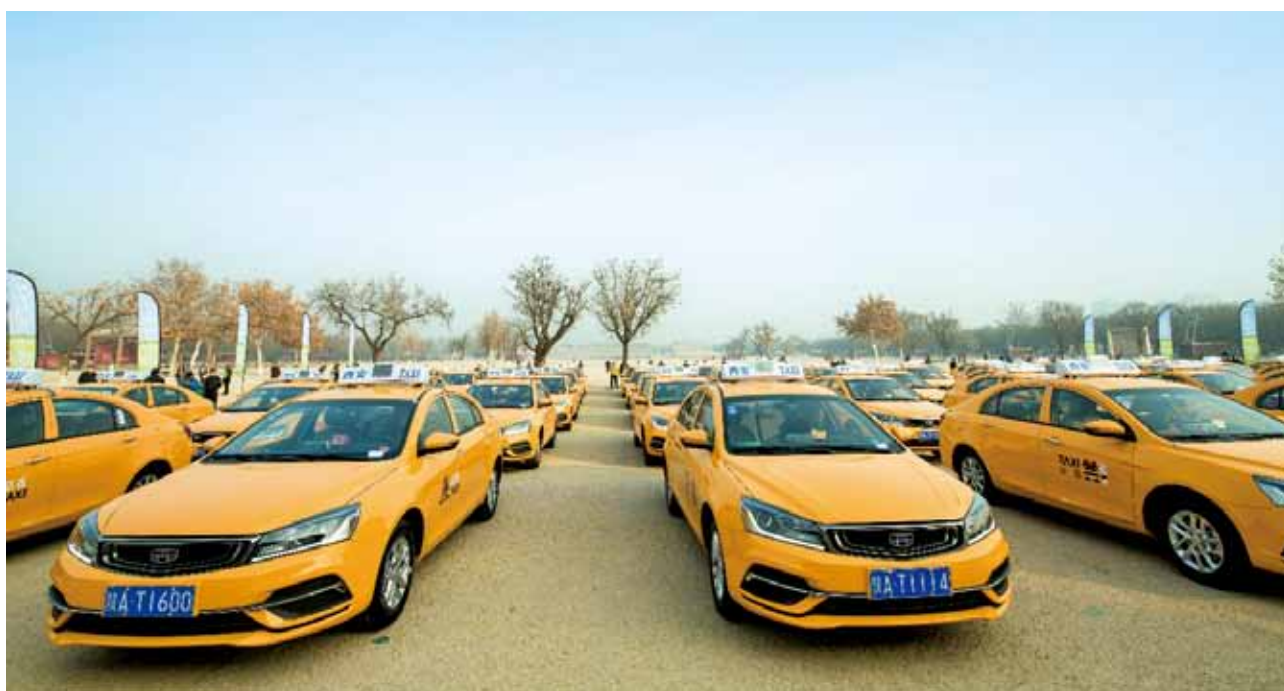
2018 年 12 月 20 日，西安市首批以甲醇为燃料的 20 辆出租汽车开始运营