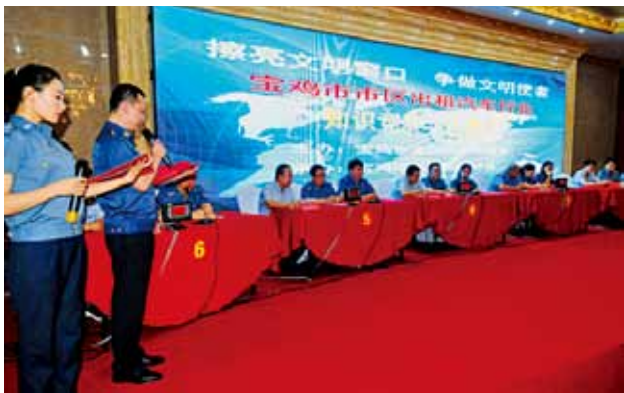
2018年7月10日，宝鸡市组织市区15家出租汽车公司开展市区出租汽车行业知识竞赛

【行业监管】 2018年，宝鸡市组织经常性稽查巡查活动，加强地域交叉执法，联合交警执法，查处非法营运车辆156辆。按照“以人为本，安全第一，预防为主，综合治理”的方针，建立权责清单，梳理制定行业安全生产6项监督检查事项清单和18项安全生产权责清单。成立专项检查组，3次对市区客运、危险品运输、重点物流企业拉网式排查，发现安全隐患96处，下发整改通知书1份，行政处罚1家企业，对检查情况进行全市通报。加强从业人员培训教育、注重事故案例警示，组织从业人员安全培训23期，培训客运驾驶员2800名，指导各运管所对辖区“两客一危”及出租汽车企业140名负责人进行培训。