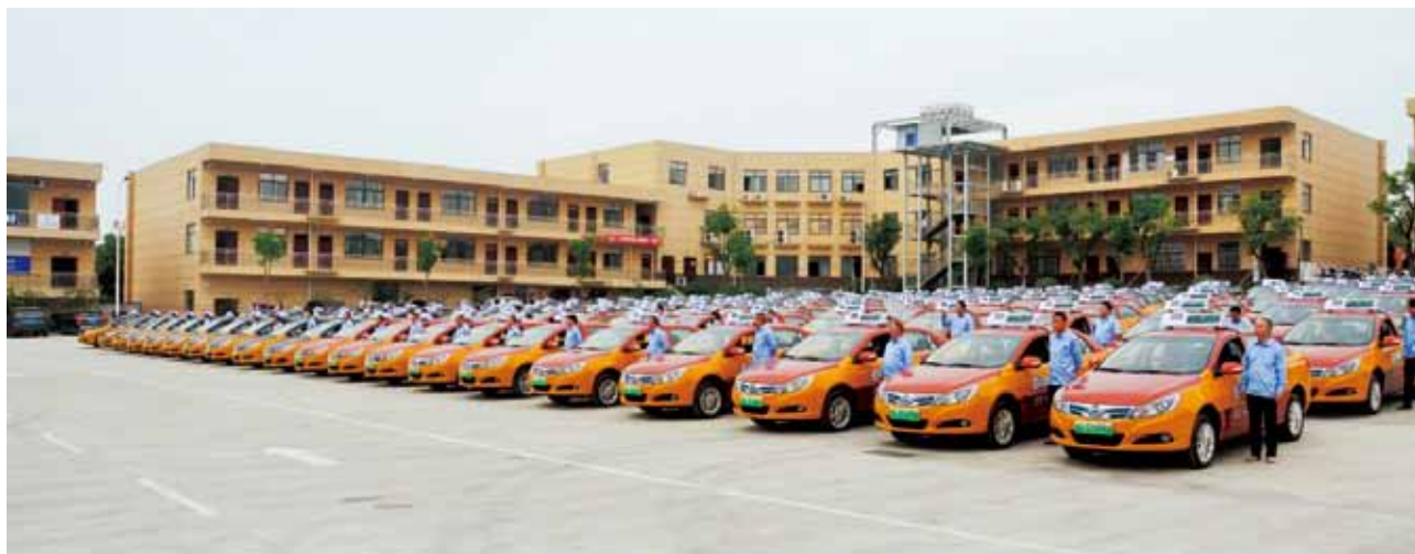
2018年8月24日，安康市中心城市投放200辆纯电动出租汽车

【维修驾培】 2018年，安康市推行汽车维修电子健康档案系统建设工作，全市二类以上116家维修企业建立汽车维修电子健康档案，上传2.8万车次维修车辆信息、6.8万条维修记录。开展“汽车维修质量服务月”活动。10家综检机构实现货车“两检合一”，按照“一次上线、一次检测、一次收费”原则，出具安全技术检验和综合性能检测两份报告，为营运货车年检和年审提供技术依据。取消营业性货车二级维护强制上线检测，由经营者以确保车辆安全性能为前提，自主确定二级维护周期，自行组织车辆维护，降低货车运营成本。推进驾培机构服务模式改革，全市驾培机构计时培训、按学时收费、先培训后付费模式覆盖率100%。全市29所驾培机构全部使用并升级计时培训管理系统，948辆驾培培训车辆全部安装并升级车载计时刷卡设