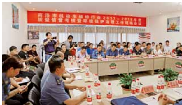
2018年，商洛市机动车维修行业质量信誉考核暨环境保护治理工作现场会召开

【维修驾培】 2018年，商洛市开展机动车维修企业治理废气、废物活动，全市110家维修企业达到治理要求，安装排污治霾设备112套。完成继续教育培训学员1675人，410名学员初次培训并考试合格后取得资格证。在2018年度质量信誉考核中，全市25家机动车驾驶培训机构，评出优秀培训机构6家、良好培训机构5家、合格培训机构14家。驾培机构全部安装计时系统。