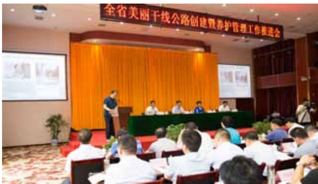
2018年6月26日,省公路局在渭南市召开陕西省美丽干线公路创建暨养护管理工作推进会

【公路建设】 2018年,渭南公路管理局公路建设项目5个,完成投资1.36亿元。其中完成310国道、106省道、107省道、202省道渭南段4条25公里公路养护大中修,投资7000余万元。242国道韦庄—汉村段一级公路改建工程建成通车。209省道临蒲界—故市暨渭河特大桥及引线工程开工建设,全长30.45公里,总投资10.96亿元,完成投资4100万元。完成106省道富平—蒲城段、201省道澄城冯源—黄龙界段、202省道大华路段30.57公里生命安全防护工程,完成投资592万元。完成108国道、107省道、201省道、202省道4条公路25处水毁修复工程,完成投资508万元。