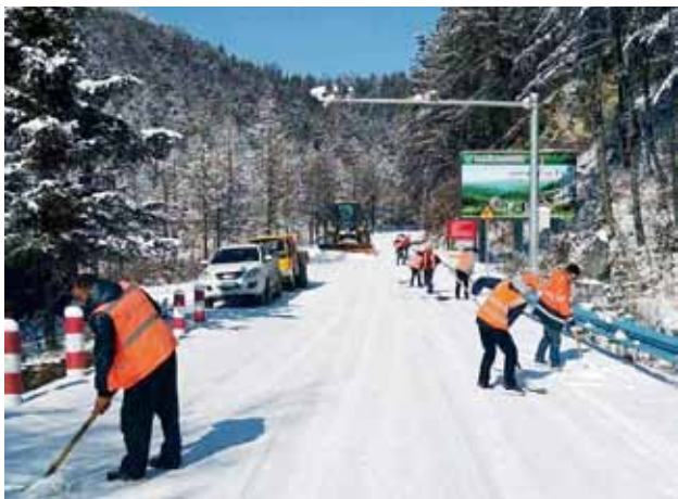
2018 年 1 月，安康公路管理局职工清除公路积雪

支共 310 名队员的公路应急保障突击队，清除塌方和泥石流 37.2 万立方米 / 1990 处，抢通道路阻断 67 处，用最短时间恢复道路通行。及时修复水毁路基缺口及沿线构造物，全年全市干线公路发生一般水毁 115 处、重大水毁 9 处，除 3 处重大水毁修复方案和设计图待省公路局审查外，其余全部修复完毕，完成路面大中修和预防性养护工程 59.9 公里。