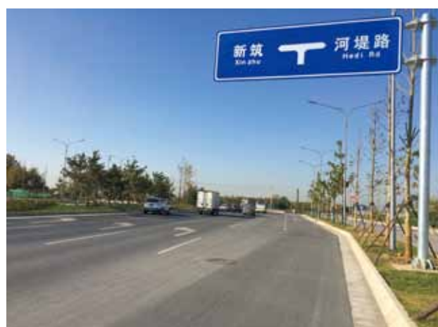
2018 年 5 月，西安市灞桥区纺渭路改扩建工程竣工通车

【安全生产】 2018 年，西安公路管理局完成 272 座桥梁安全隐患排查，对 4 座护栏不满足要求的桥梁进行改造，全面实施 3 座隧道洞口隐患整治工程。实现“以雪为令、边下边清、雪停路净”除雪保通目标。及时修订应急救援预案，组织开展防汛、防滑抢险救援演练，配合市交通运输局完成干线公路工程抢修应急救援演练和国防交通工程抢修演练。及时上报水毁信息，险情排除迅速有序。开展防范和遏制重特大道路交通事故大会战、安全生产攻坚专项行动，组织安全生产专项检查，发现并整改隐患 194 处。开展安全生产教育培训活动 20 次，参训职工 6200 多人次。