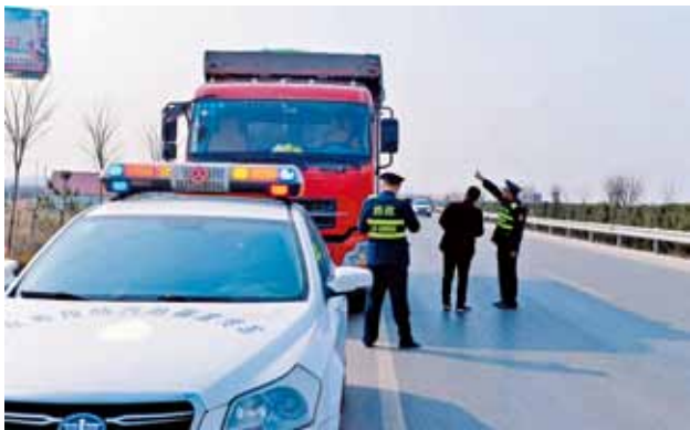
2018年4月，永寿公路管理段路政人员整治312国道永寿段货车沿路抛撒

治施工图设计。认真实施公路水毁修复、危桥改造、生命安全防护工程和隧道整治，完成投资 2900 多万元，确保列养公路安全平稳运行。全年无安全责任事故发生。