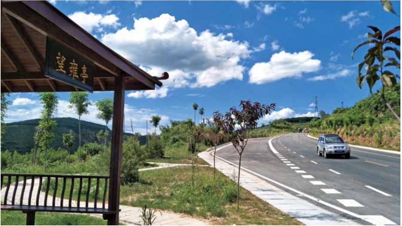
2018年，244国道陕甘界至凤翔县（K50+800）停车区及道路建设完工

公路760.26公里、三级公路113.35公里。在职职工1197人，离退休职工850人。局机关设办公室、养护计划科、路网信息科、工程管理科等科室，下辖陈仓、金渭、凤县、太白、眉县、陇县、千阳、凤翔、岐山、扶风、麟游等11个公路管理段，大湾铺、两亭、晁峪、草碧等4个超限运输检测站。2018年，完成养建投资2.61亿元，占年计划100%，被省公路局评为2018年度养护管理工作先进单位，被市交通运输局评为2018年度全市交通运输行业安全生产先进单位。