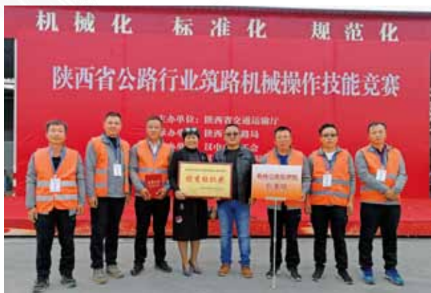
2018年10月16日，榆林公路管理局荣获陕西省公路行业筑路机械操作技能竞赛优秀组织奖

【路政治超】 2018年，榆林市干线公路发生路政事案2804起，查处2803起，收回路产赔偿费261万元、占用费1300万元。干线公路超限运输检测站检测货运车辆1152.5万辆次，处理超限超载运输车辆8751辆次，卸分载货物4.69万吨。向运管部门抄送1706辆次属“一超四究”车辆信息。办理车辆超限运输通行证1890个，监护大件运输车辆1355辆，收取监护费222.56万元。