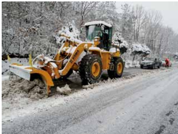
商洛公路管理局在 312 国道 K1247+800 段除雪保畅

【路政治超】 2018 年，商洛公路管理局所属超限运输检测站检查车辆 7 万余辆，其中超限超载运输车辆 262 辆，超限超载运输率 0.4%，卸分载货物 4762 吨。流动稽查人员检测车辆 1.8 万余辆，卸货点检测车辆 18 万余辆，超限超载运输率分别为 2% 和 0.01%。查处路政事案 146 起，办理公路行政许可事项 8 件。与渭南市治超办开展区域联动治超，有效保护路产和维护道路交通安全。