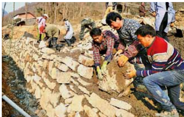
2018年1月，汉中市宁强县汉源街道办元家洞村村民利用冬季农闲时间，在公路边修砌路基挡墙，改善农村交通环境 (年鉴编辑部)

【新技术使用】 2018年，汉中公路管理局在公路大中修工程中，通过厂拌冷再生新工艺利用旧铣刨料近2万立方米，节约成本239万元。在42公里沥青混凝土路面施工中使用SBS改性沥青5000余吨。针对过村镇道路水泥混凝土路面振动破碎问题，引进共振碎石化技术，修复破碎路面2万余平方米。针对褒河库区1.2公里长大纵坡，和西安公路研究院合作，投入60余万元在沥青混凝土路面中加入抗车辙剂，提高路面高温稳定性和低温抗裂性能。