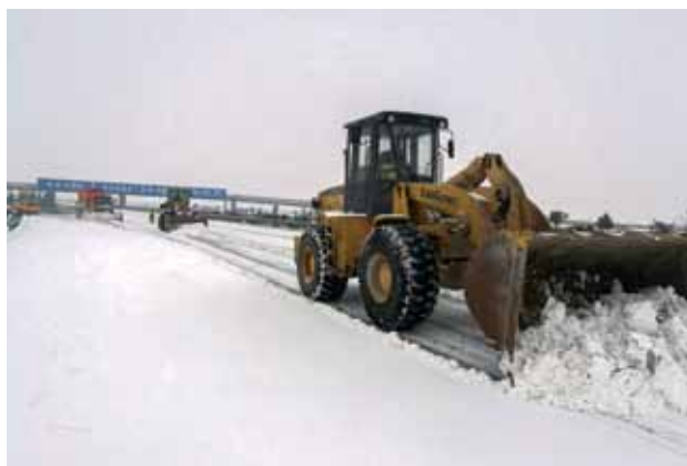
2018 年 1 月 4 日，省交通集团西安绕城分公司高速公路养护人员除雪保畅