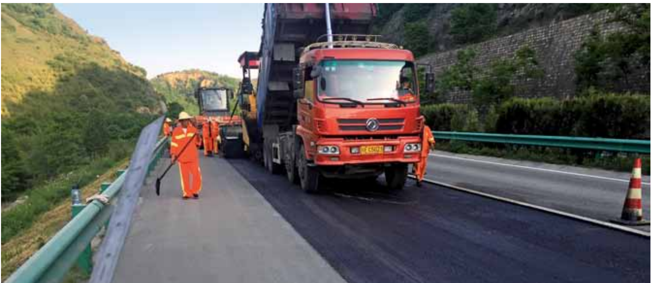
2018年6月2日，西（安）延（安）高速公路路面养护施工（省高速集团）