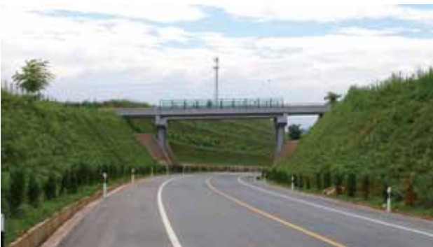
344国道凤翔县石家营至千阳县改建工程（K43+500）县城过境段绿化工程竣工 2018年7月16日摄（宝鸡公路管理局）

【农村公路养护工程】 2018年，省交通运输厅下达省公路局农村公路养护工程投资计划5.2亿元，全省公路系统完成投资5.2亿元，占计划100%。农村公路路网结构工程计划投资6.3亿元，完成投资8.5亿元，占计划135%。其中公路安全生命防护工程计划投资5.1亿元，完成投资7.4亿元，占计划145%；危桥改造工程计划投资1.2亿元，完成投资1.1亿元，占计划91.7%。全省农村公路技术状况指数（MQI）66.58，其中县乡道74.71、村道63.05。优良路率31.2%。