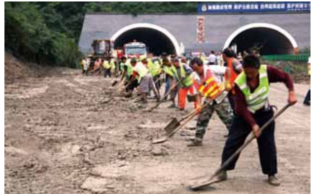
2018年7月14日清晨，省高速集团西略分公司迅速抢通十天高速公路略阳段水毁路段

前公路排查、冬季除雪防滑保畅等工作。每季度对所辖14家运营公司开展公路养护工作检查，下发养护检查通报4次，促进路容路貌改善和养护管理水平提升。在汉川高速公路试行日常养护总承包制，在西延、西汉高速公路试行日常养护监理制，进一步探索日常养护管理新模式。