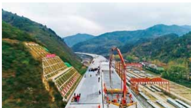
2018 年 5 月，太（白）凤（县）高速公路王家山特大桥桥面铺装施工 (省高速集团)

【太白至凤县（陕甘界）高速公路建设持续推进】 项目是陕西省高速公路网规划的 18 条联络线之一，路线起于太白县城西侧，与姜眉公路相接，向西经靖口镇、平木镇，与银昆高速在田坝枢纽互通相接，经河口镇、凤州镇，沿嘉陵江，穿越凤县北侧山岭至省界，与甘肃省十天高速两当连接线相接。路线全长 85.07 公里，采用双向四车道高速公路技术标准，设计速度 80 公里/小时，路基宽 25.5 米。拟建桥梁 2.75 千米/59 座（全幅），隧道 2.02 千米/11 座（双洞），桥隧比 56%。设互通式立交 4 处、服务区 1 处、停车区 1 处、收费站 5 处。概算投资 93.3 亿元，计划 2020 年全线建成通车。2018 完成投资 23.57 亿元，自开工累计完成投资 43.63 亿元。 (省高速集团)