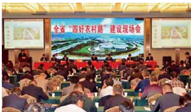
2018年10月12日，省政府在宝鸡市眉县召开全省“四好农村路”建设现场会

【交通扶贫】 2018年，陕西省公路系统完成农村公路建设脱贫保障性项目——续建项目：113个建制村651公里农村公路续建。退贫项目：周至、延川、宜川3县退出贫困县82.7公里农村公路建设；52个退出贫困建制村309.8公里农村公路建设。