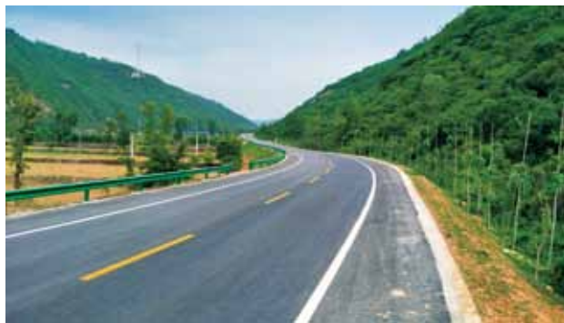
244国道陕甘界至凤翔县改建工程完工 2018年6月3日摄

下达省公路局普通干线公路路网建设计划103个项目、建设里程2776.1公里、投资65.6亿元。至年底，全省公路系统完成投资110.2亿元(含完成14.1亿元拟升国道公路建设投资)，占计划167.9%，较2017年提高67.1个百分点。其中续建项目53个、建设里程1326.1公里、投资63.8亿元，完成投资61.7亿元，占计划96.5%。尾留项目47个、建设里程1437.2公里，投资246.5亿元，完成投资32亿元，自开工累计完成投资223.8亿元，占总投资90.8%。新开工项目3个、建设里程12.8公里、计划投资1.8亿元，完成投资1.6亿元，占计划89.8%。(详见表11陕西省2018年干线公路路网建设投资完成情况汇总表)