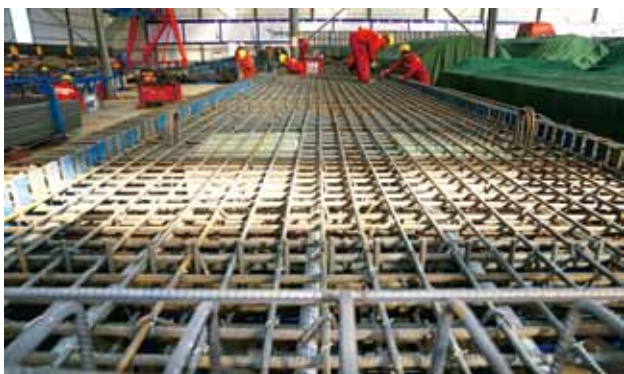
2018 年 12 月 17 日，西（乡）镇（巴）高速公路 XZ-04 合同段板梁厂预制桥面板钢筋绑扎胎架

【安康至岚皋（陕渝界）高速公路建设持续推进】 项目是国家高速公路网银（川）百（色）线（G69）组成路段，路线起于安康市汉滨区月河河北岸，与十（堰）天（水）高速公路衔接，穿越汉滨区、岚皋县，止于陕渝界大巴山隧道省界处，与拟建的重庆市开县至城口高速公路相接。路线全长 88.58 公里，总投资 156.87 亿元，桥梁总长 3.85 千米，隧道总长 3.97 千米，桥隧比 85.6%。设互通式立交 5 处、服务区 2 处、收费站 5 处。2018 完成投资 18.35 亿元，自开工累计完成投资 27.61 亿元。