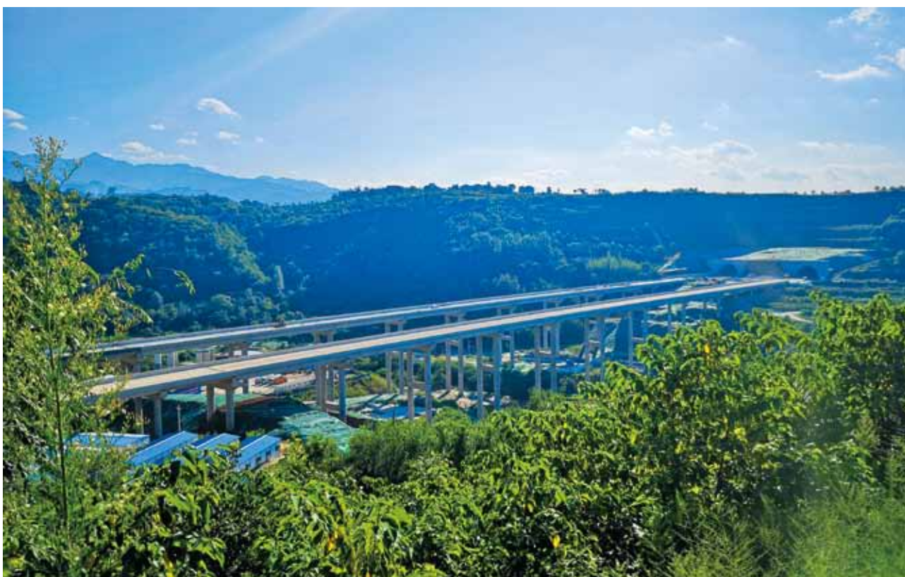
2018年8月22日，建设中的宝鸡过境高速公路三岔河大桥

【子长至姚店高速公路开工建设】 项目起于子长县东约 11 公里好坪沟口，设枢纽立交与清涧至子长高速公路相接，途经徐家岔、常家新庄、董家寺、永坪镇、刘家渠、贺家渠、孙家渠、老牛塬、赵家疙瘩、桃家屯，终点在黄家屯设枢纽立交与延延高速公路相接，2018 年 7 月开工建设。路线全长 55.36 公里，概算投资 60.91 亿元，计划 2020 年建成。2018 年，完成建设投资 14.4 亿元。完成路基工程 41%、桥梁工程