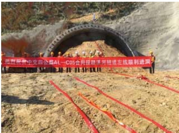
2018 年 10 月 10 日，安（康）岚（皋）高速公路项目控制性工程驷溪河隧道左线顺利进洞

【安康至岚皋（陕渝界）高速公路建设持续推进】 项目是国家高速公路网银（川）百（色）线（G69）组成路段，路线起于安康市汉滨区月河河北岸，与十（堰）天（水）高速公路衔接，穿越汉滨区、岚皋县，止于陕渝界大巴山隧道省界处，与拟建的重庆市开县至城口高速公路相接。路线全长 88.58 公里，总投资 156.87 亿元，桥梁总长 3.85 千米，隧道总长 3.97 千米，桥隧比 85.6%。设互通式立交 5 处、服务区 2 处、收费站 5 处。2018 完成投资 18.35 亿元，自开工累计完成投资 27.61 亿元。