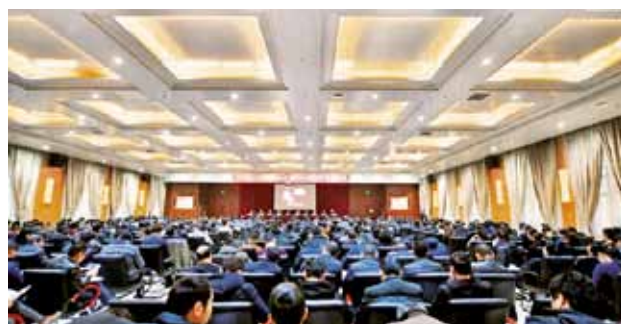
2018年1月18日，省交通设计院召开职工大会

型发展后劲；牢固树立“安全第一”方针，抓好安全生产和综合治理工作，确保交通规划设计研究持续健康稳定发展。