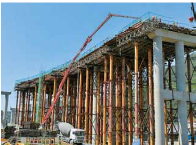
2018年8月12日，平镇高速公路南江河特大桥 现浇段施工现场

【平利至镇坪高速公路建设持续推进】 项目是国家高速公路联络线 G6911 安康至来凤高速公路组成路段，也是陕西省“2367”高速公路网联络线，路线起于平利县城关镇龙古村，与建成通车的 G4213（麻城至安康）段安康至平利高速公路龙古枢纽立交相接，终点至陕渝界鸡心岭隧道两省（市）交界处，与重庆市规划的巫溪至陕渝界高速公路相接，主线全长 84.88 公里（陕西段 81.44 公里，省界鸡心岭隧道 3.45 公里由重庆市建设）。概算投资 110.41 亿元，