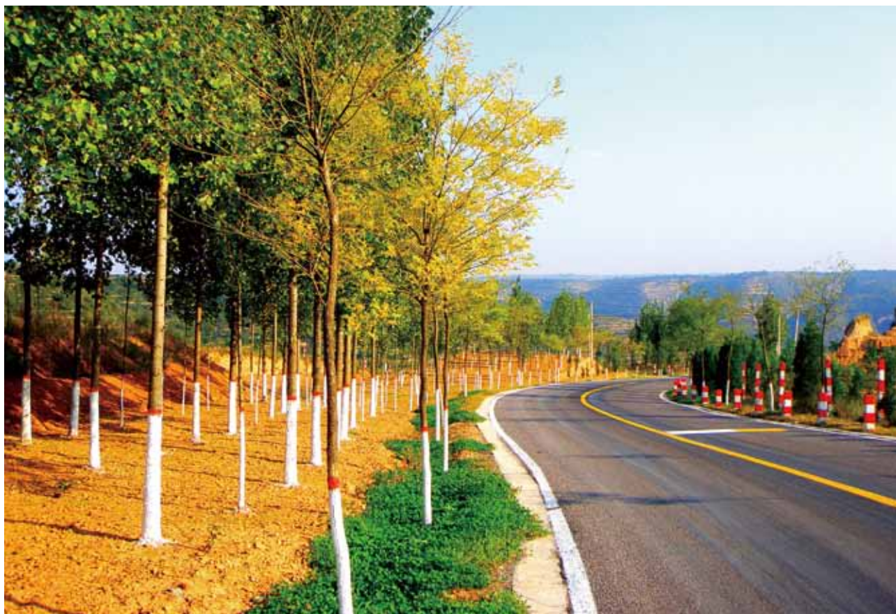
2018 年，美丽的咸阳市长枣路（咸阳市交通运输局）

855 辆，农村客运班线 257 条，新增通客车建制村 63 个，建制村通班车率为 99.4%。同时，不断扩大城市公交线网覆盖，2018 年市区新增优化公交线路 14 条，完成 170 辆纯电动公交车新增和更新工作，市区新能源车比重达到 55%，建成公交电子站牌 24 个。全市增加旅游客运车辆 119 辆，咸阳北站旅游集散中心正式运行。与大西安深度融合，积极探索开通城际公交，重点推进泾阳—西安 1 号线、2 号线和咸阳马庄—西安（39 路）客运班线公交化运营改造工作。以兴平市、淳化县创建城乡道路客运一体化试点项目为带动，推进全市城乡一体化发展。推进道路客运转型升级，提升道路客运服务品质，实现了咸阳机场至安康、宝鸡“空巴联运”，让乘客出行实现“直达直通”。开展星级汽车客运站创建评选活动，鼓励品牌服务、创新服务，西安咸阳国际机场长途客运站创建四星级汽车客运站顺利通过省运管局验收。完成春运、十一等重点时段旅客运输任务。全市 2018 年春运期间运送旅客约 515.53 万人，同比下降 8.4%。春运、国庆等重大假日期间未发生道路安全事故和旅客滞留事件。十六运期间投入各类营运保障车辆 1000 余辆，客车储备运力 100 辆，开幕式当天，运送运动员、教练员、裁判员、志愿者、演职人员、市民群众 8 万余人次，圆满完成陕西省十六运交通运输保障任务。