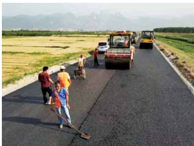
2018 年，华阴市农村公路路面施工现场（武迪）

【公路养护管理】 合阳县被评定为“四好农村路”国家级示范县，由渭南市公路处牵头并以市政府名义起草加快四好农村路建设意见，推广大荔、合阳创建经验；实施“油返砂”项目 1771 公里，创建美丽乡村公路 160 公里；农村养护工程完成投资 2.1 亿元，实施一批养护、大中修、安全生命防护、危桥改造、通村公路完善工程；干线公路完成大中修 25.3 公里，完成计划投资 7000.56 万元；组织各县全面实施全市道路绿化提升工程，截至 2018 年年底完成道路绿化 2990 公里，完成投资 15 亿元。