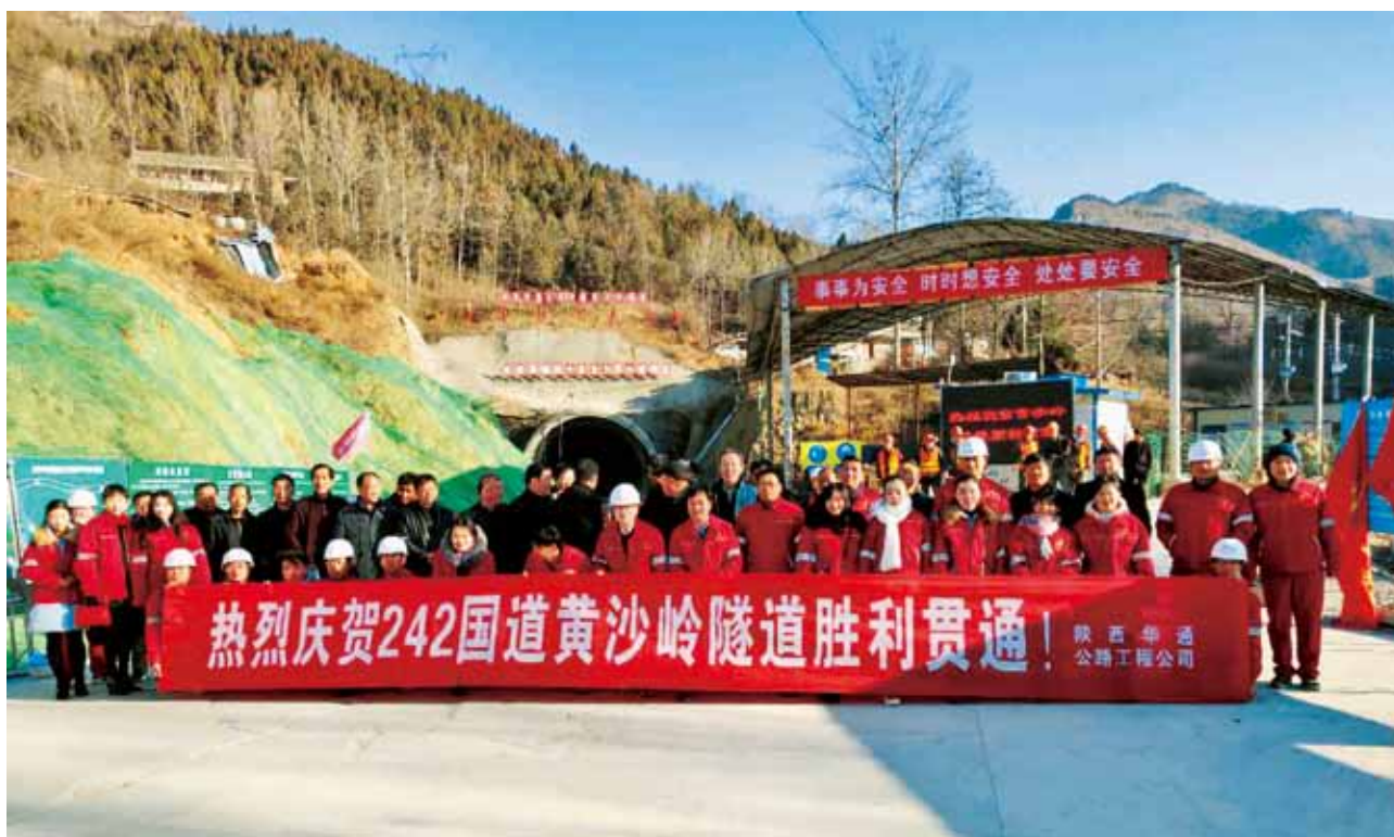
2018年，242国道黄沙岭隧道顺利贯通（董旭）

商洛市7县区高速实现互通，商洛境内高速公路通车里程突破500公里。普通公路建设完成投资27.63亿元，307省道柞水小岭梁隧道正式通车运营，242国道洛南至商州公路黄沙岭隧道贯通，224省道商南至魏家台、345国道户垣至界河、木王林场至栗扎等5个项目按计划推进。农村公路建设完成投资18.02亿元，建成县乡公路259.3公里，桥涵配套及危桥改造35座1800.7延米、安全生命防护工程2102.3公里。客货运站点建设完成投资4500万元，商洛陆港实业（集团）有限公司公铁联运完成铁路专用线及货场基础工程建设，洛南、丹凤二级客运站和镇安永乐四级客运站主体完工。