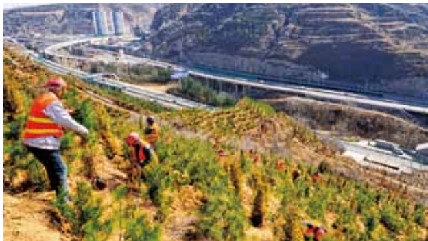
2018 年，铜川市王益区川口至耀州区青岗岭区域生态修复项目春季绿化大会战（黄承甲）

装载源头远程视频监控率达 100%，干线公路检测货运车辆 613996 辆，农村公路检测货运车辆 180983 辆，干线、农村公路超限超载率分别为 0.04%、0.01%。