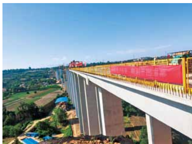
2018 年，107 省道扶杨眉公路在建项目（李 聪）

【107 省道扶杨眉公路建设】 107 省道扶杨眉公路工程杨凌段长 13.155 公里，建设标准为一级公路，路面宽度 24.5 米，控制性桥梁 3 座，桥涵设计汽车荷载采用公路 -I 级，全线设计为沥青混凝土路面，设计时速 80 公里，预算投资 5.823 亿元。截至 2018 年年底，该项目五泉段 5.5 公里已建成通车，马超岭大桥已完成桥面铺装；揉谷段已完成特大桥下部结构施工，正在进行梁板预制及架设，预计 2019 年 10 月底建成通车。