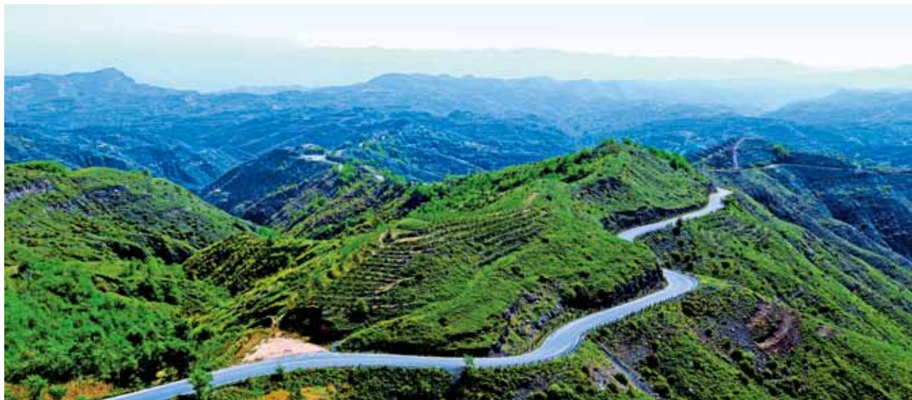
2018 年，韩城市西部山区公路（史济源）

【脱贫攻坚】 2018 年，韩城市投资 1.3 亿元完成贫困村道路硬化 88 条 185 公里；扎实开展“双万工程”帮扶行动，实施残疾人免费乘坐公交车、建档立卡贫困户报考驾培中心资费优惠等政策；实施县乡公路改建、建制村通畅、安全生命防护、桥涵配套及危桥改造、通村公路完善、通村通组公路建设和“油返砂”整治等七大交通惠民工程共计 258 公里；坚持“建管养运”并重，积极开展“四好农村路”