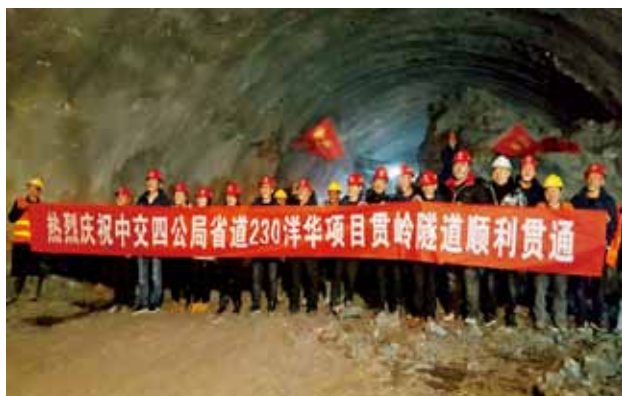
2018年12月，230省道洋县至华阳公路控制性工程贯岭隧道贯通

【运输服务】 加快智能公交建设，中心城区完成400余辆公交车一体化智能车载信息系统改造，“易公交”手机App上线运行，手机扫码支付乘车启动试运行，汉中天汉“一卡通”公交卡与全国228个城市互联互通。积极发展旅游客运，建成游客集散中心8个，新投放旅游客车51辆。新增通客车建制村33个，建制村通客车率达到97%、通邮率达到100%。探索推动交邮融合发展，建成农村电商示范网点7处，新增农村电商服务点87个，累计建成便民服务站944个，协调推动京东公司在汉中设立“云仓”，汉中交邮融合的做法在2019年全国邮政管理工作会议上推广。