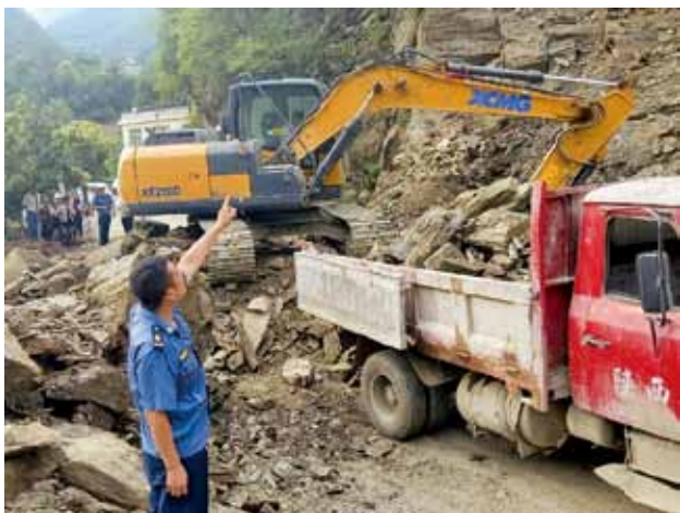
2018 年 6 月 16 日，旬阳县农村公路管理局抢修水毁公路

绿化工程 2018 年，旬阳县交通运输局投资 670 万元绿化金张路 16.8 公里。投资 120 万元绿化双上路 30 公里。投资 36 万元对县城南大门绿化提等升级。投资 70 万元，栽植各种树木 1 万余棵，铺设人行步道 50 余米，安放景观石 5 处。投资 130 万元绿化罐罐沟至汉江大桥头及汉江大桥三角区。投资 20 万元绿化吕河镇秦家塔村组道路 27.8 公里。投资 15 万元绿化段家河镇向庄村级示范路 3 公里。完成通村公路完善工程项目 14 条 69.1 公里，安全生命防护工程项目 27 个 200.03 公里，完成完善工程和安全生命防护工程项目 2 个 10.38 公里。被省政府授予“四好农村路”示范县荣誉称号。