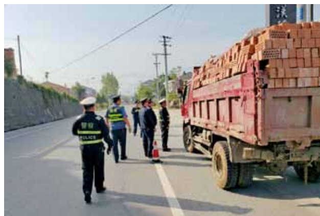
2018 年 5 月 9 日，汉阴县开展道沿路抛洒等道路环境整治

路政治超 2018 年，汉阴县交通运输局查处损坏路产事案 4 起，查处结案率 100%，收取路产损失赔偿补偿费 6200 元。检查车辆 178 辆，源头劝返超限车辆 10 辆，卸载超限超载车辆 5 辆，超限超载率稳定控制在 3% 以内，货物源头监管率 100%。