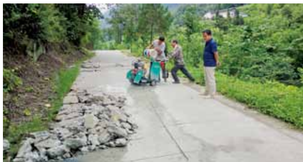
2018 年，石泉县正式启动“油返砂”修复工程

开展船舶污染防治大检查 56 次，检查各类船舶 800 艘，查处违章船舶 57 艘。