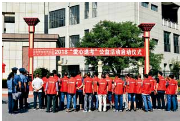
2018 年 6 月 6 日，平利县交通运输局“爱心送考”举行启动仪式

脱贫攻坚 2018 年，平利县实施深度贫困村通组路硬化 34.4 公里、“油返砂”整治 154.7 公里、桥梁 8 座 394.2 延米、引线 547 米，总投资 1.07 亿元。脱贫村 13 个项目全部完工。