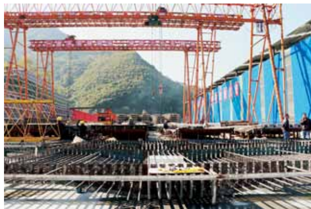
2018年,镇坪县正在施工的平镇高速公路施工现场

【镇坪县交通】 2018年,镇坪县交通运输局内设政办股、规划股、安监股、基建股4个股室,下辖农村公路管理局、道路运输管理所、地方海事局、交通建设工程质量监督站4个单位。公路总里程629.2公里,公路网密度41.86公里/百平方公里。完成货运量44.86万吨,货物周转量2384.24万吨公里。完成客运量53.79万人次,客运周转量5059.46万人公里。