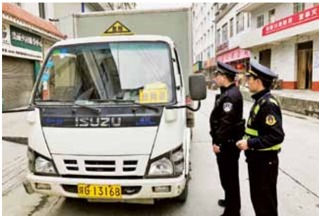
2018 年，镇坪县交通运输局运政执法现场

违法违规车辆 57 辆。抽检维修企业 25 家，现场整改 9 家。新引进 25 辆电动能源公交车并运营。海事局第一次成功完成一起搜救任务。第一艘执法船“陕海巡 76”列编。