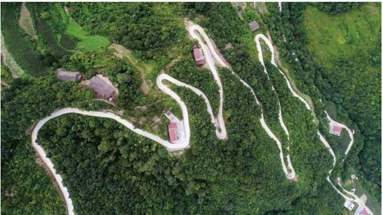
2018年6月，汉滨区坝河镇伍家湾村通村公路建成通车

运输管理 2018年，汉滨区交通运输局培植规模以上交通物流企业2家，包抓规模以上服务企业7家，新增货运企业20家，新开通通村客运线路7条，加强“两客一危”运输企业卫星定位系统日常使用和监管，开展非法营运专项整治行动，累计查处违规客运车辆133辆（次），查处非法运营“黑面的”45辆次，查处纠正企业违规经营行为