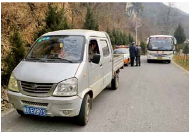
2018 年 2 月，宁陕县运管所开展打击非法营运专项活动

运行，袁家端二号隧道贯通，朱家嘴隧道开工建设，完成投资 3600 万元。皇冠镇庙坪至江口镇双河公路路基工程开工建设。皇冠镇收费站至八宝土地沟口、筒油路工程完工，累计完成投资 5181 万元。筒车湾镇油坊坪至梅子镇瓦房公路 21.7 公里路基拓宽改建 8.2 公里路面工程完工，完成投资 6300 万元。龙王至梨子园三级公路、月太路主体工程完工，完成投资 5800 万元。广货街镇蒿沟三级公路路基工程完工，完成投资 1300 万元。新五路新场至建设段路基补强完工，完成投资 700 万元。7 条通村公路“油返砂”、3 条通组硬化工程完成，完成投资 2000 万元。2 条县道养护工程主体工程完工，完成投资 500 万元。2 条深度贫困村通组公路开工建设。农村公路养护里程 953.97 公里。