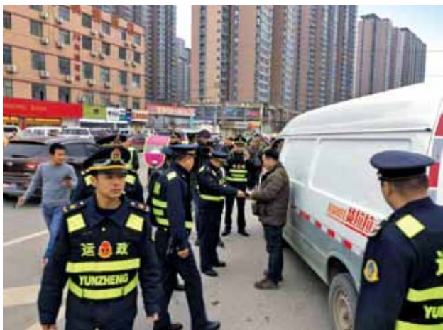
2018年，雁塔区交通运输局运政人员在杜城村进行重点区域整治（黄文伟）

辆、“摩的”314辆，驱离违章停放车辆、“摩的”18544辆，清理占道经营纠正“九乱”现象1861起。