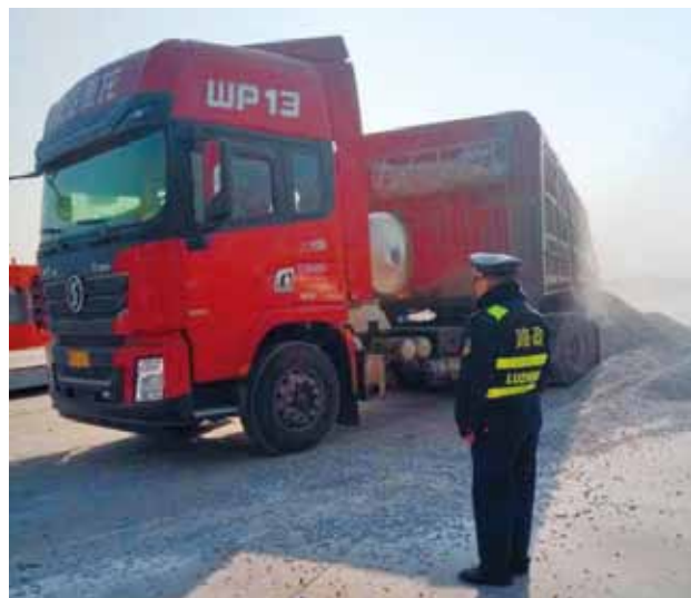
2018年,高陵区交通运输局依法对超限车辆进行卸载

路政治超 2018年,高陵区交通运输局制止违法占用、损坏公路路产行为41起,处理路产损坏事案17起,收取公路损坏赔(补)偿费14.15万元。联合治理违法超限运输车辆136车次,卸(分)载货物2836.93吨。监护大件运输车辆4车次。