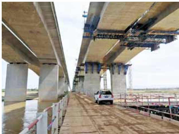
2018 年，临潼区交通运输局 310 国道二期改造工程现场

【阎良区交通】 2018 年，阎良区交通运输局内设综合科、交通运输管理科、公路建设管理科 3 个科室，下辖农村公路管理站、交通运输管理站、出租汽车管理所 3 个单位。公路总里程 600.03 公里，公路网密度 246 公里/百平方公里。完成货运量 6643.58 万吨，货物周转量 9.3 亿吨公里。完成客运量 1672.75 万人次，客运周转量 10.71 亿人公里。