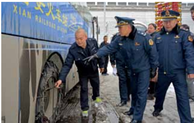
2018年1月4日，新城区交通运输局局长在雪天检查班线车安全防滑情况

运输管理 2018年，新城区交通运输局对客货运输企业进行督查，查处违规货运车辆268辆。开展联合执法31次，查处非法客运车辆703辆，处置投诉46起，处置率100%。总质量12吨及以上的普通货运车辆加装卫星定位装置（北斗）300辆，安装率100%。核查运输车辆1123辆。