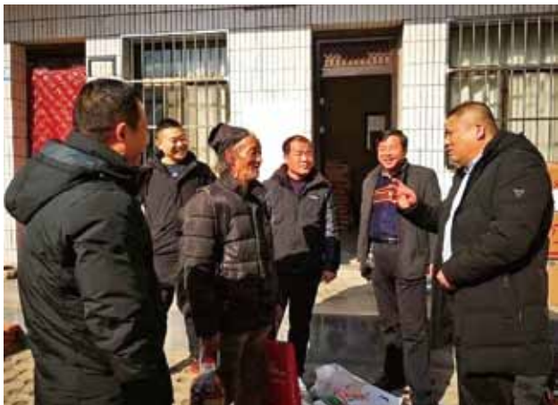
2018 年，长安区交通运输局深入杨庄街办西木村进行扶贫帮困

【临潼区交通】 2018 年，临潼区交通运输局内设办公室、运输管理科、公路建设管理科 3 个科室，下辖交通运输管理站、农村公路管理站、出租汽车管理所、交通派出所、新丰大桥管理处 5 个事业单位和临潼汽车站、秦俑车场管理处、临潼区汽车运输公司、第二运输公司、第三运输公司、桥梁建筑安装工程公司、西安骊通公路工程养护有限公司 7 个国有企业。公路总里程 1723 公里，公路网密度 188 公里/百平方公里。完成货运量 345 万吨，货物周转量 1969 万吨公里。完成客运量 3.65 亿人次，客运周转量 2368.5 万人公里。