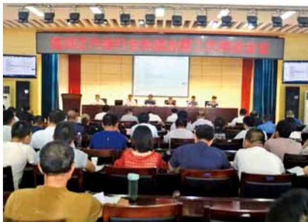
2018 年 8 月 28 日，莲湖区汽修行业铁腕治霾工作推进会在莲湖区委党校召开

安全生产 2018 年，莲湖区工信局开展三类维修、海事等行业安全检查 303 次，检查企业 464 家次。组织安全生产培训宣传 3 次。组织区级领导督查交通领域安全生产专项活动 13 次。组织区教育局、交警莲湖大队、区安监局等单位召开校车安全会议 2 次，开展校车安全隐患检查活动 2 次。