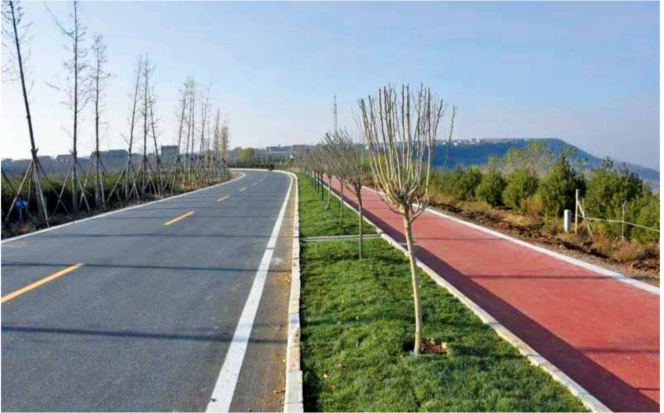
2018年，蓝田县交通运输局实施完工的白鹿原旅游专线

总投资90%。焦大路(焦岱镇—大洋峪村)改建工程完成7.47公里，占总投资82%。华羊环线(华胥—羊茂山)改建工程14.3公里及洩马路(洩湖—马湾)改建工程3公里全面完成。完成通村通组路项目6个10.42公里，实施通村公路完善工程54公里，通村公路安全生命防护工程112公里。