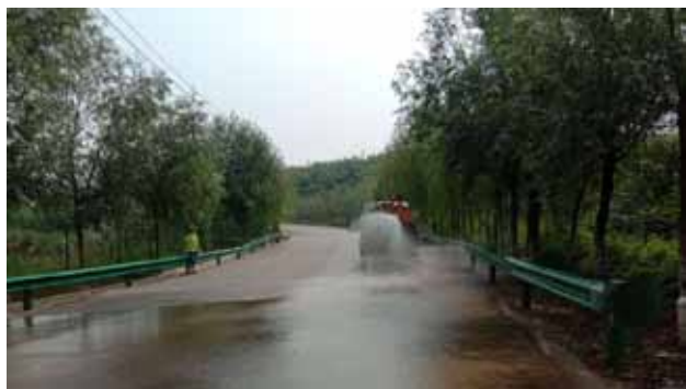
2018 年 7 月 7 日,灞桥区交通运输局在双塘路进行保洁洒水作业

公路养护 2018 年,灞桥区交通运输局重点对霸临路半引路十字至商混站段、双塘路纺一路平交口至肖家寨段进行清扫、整修、清理等日常管养。对破损路面进行小修保养。及时修复路面 3140 平方米。完成王坡村水泥路面维修 91 平方米,修复公路路面沉陷、坑槽 1095.5 平方米,施划公路标线 3301 平方米。