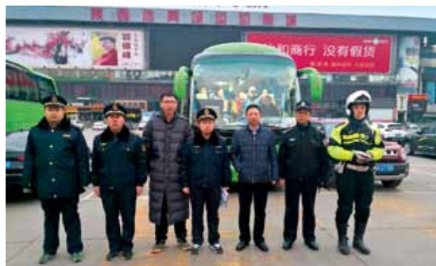
2018 年 2 月，碑林区在省体育场进行客运秩序专项整治

法 91 次，检查旅游车 1941 辆，查扣涉嫌非法营运车辆 6 辆并移交西安市运管处处理，批评教育 2 辆，未发现违法违规车辆和涉黑涉恶线索。