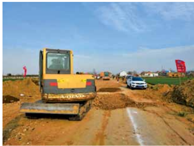
2018 年，鄠邑区王坊村出村路建设现场

公路养护 2018 年，鄠邑区交通运输局完成投资 4300 万元，实施深白路、正小路等大中修养护工程 15.9 公里及神白路、东灵路等安全生命防护工程 23.4 公里。拆除非公路标志 252 块 680 平方米，修补坑槽 1.45 万平方米，划设标线 9000 平方米，栽植警示桩 325 根。