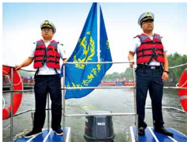
2018年6月19日，未央区交通运输局在汉城湖龙舟赛期间进行航道巡查

运输管理 2018年，未央区交通运输局新增道路运输业户4924家，审验2.25万家。新增车辆1.18万辆，审验车辆2.7万辆。审验危运业户4家，危运车辆85辆，新增危运车辆21辆。检查物流、运输、大件公司40次。开展海事安全培训教育2次，发放水上安全教育读本70册，组织检查42次，检查船舶302艘次，查处违法行为6起。