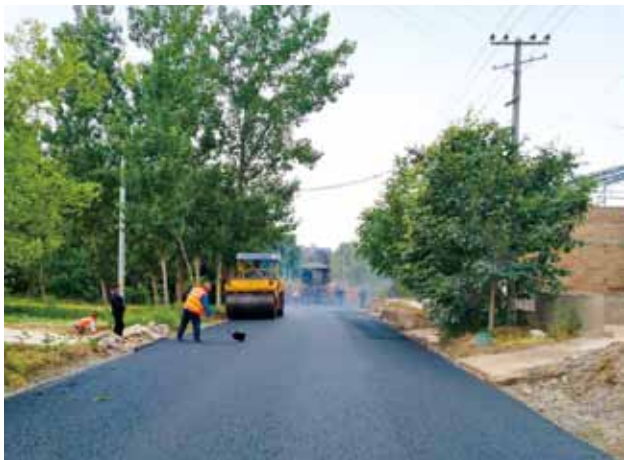
2018年,阎良区交通运输局官关路改建工程施工现场

项目建设 2018年,阎良区交通运输局完成305乡道宏腰路大修项目5.56公里,总投资600万元。改建251乡道官关路项目6.36公里,总投资1300万元。新建滨河产业路项目1.52公里,连接线440米,总投资800万元。