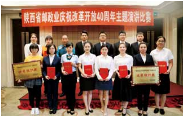
2018年9月26日，省邮政管理局“陕西省邮政业庆祝改革开放40周年主题演讲比赛”在西安市成功举办（骆延峰）

【邮政企业党的建设】 2018年，省邮政分公司认真学习贯彻习近平新时代中国特色社会主义思想和党的十九大精神，以党建为引领，牢固树立“四个意识”，坚定“四个自信”，